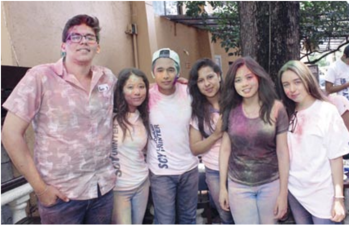
Alumnos de BIU.