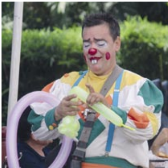
“Jujovi” y su espectáculo infantil.