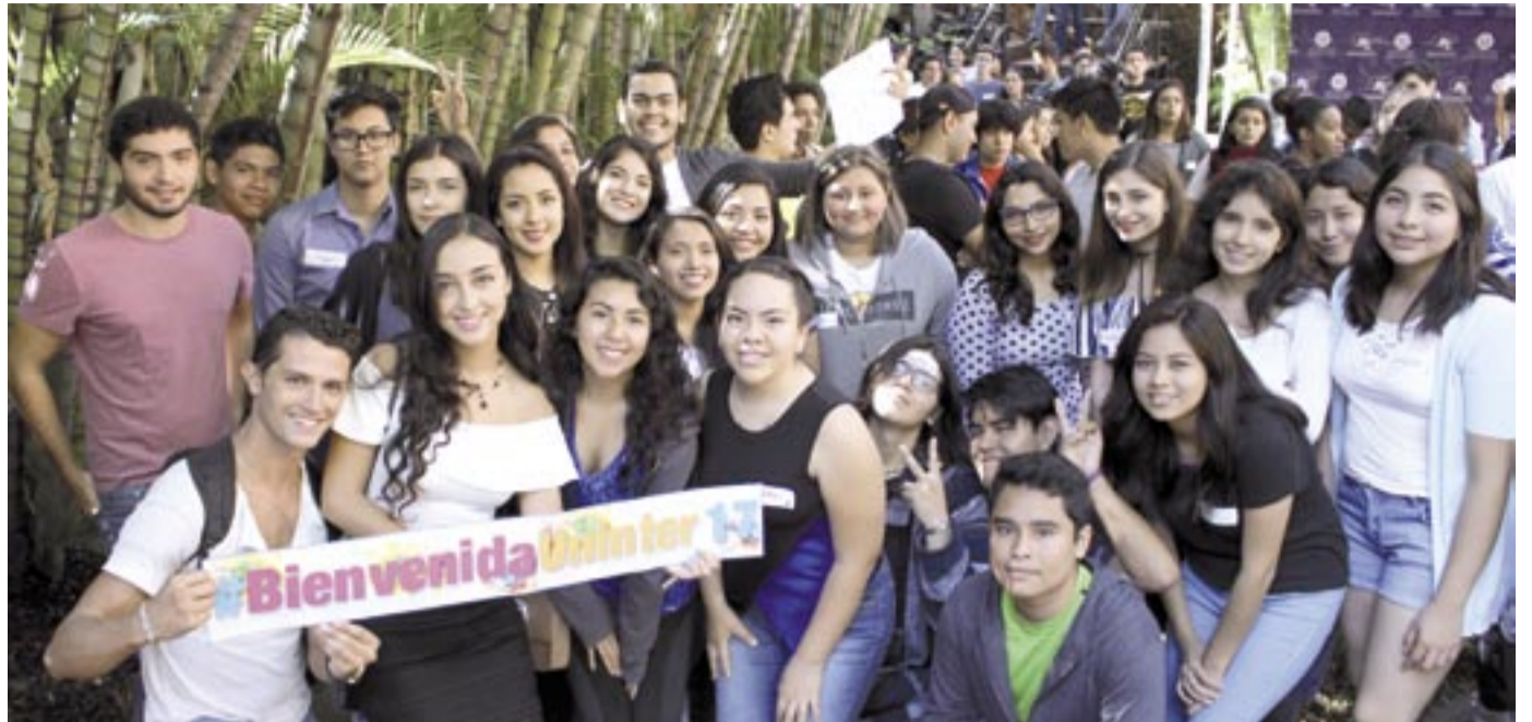
Los alumnos muy motivados durante su primer día.