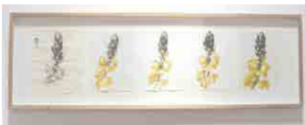
Exposición “Referencias Cruzadas”.