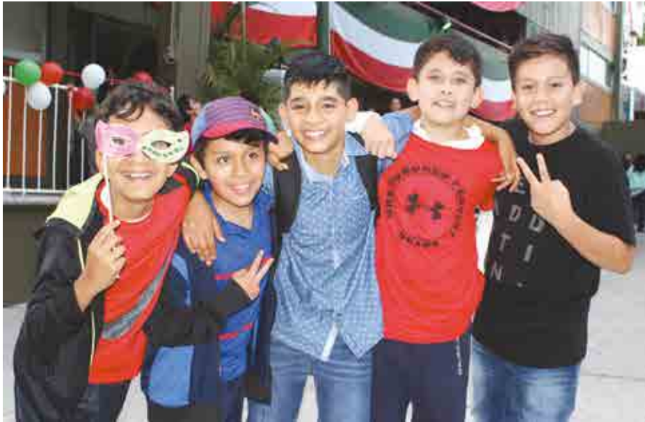
Sexto de primaria.