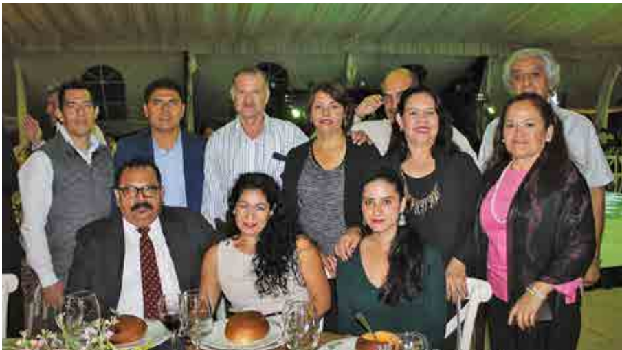
Grupo médico de Jojutla.