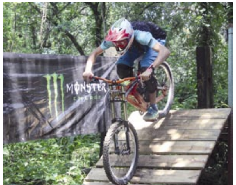
Adrenalina en cada obstáculo del descenso.