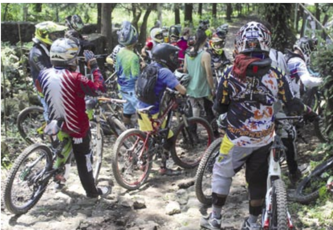
Momentos antes de iniciar la prueba.