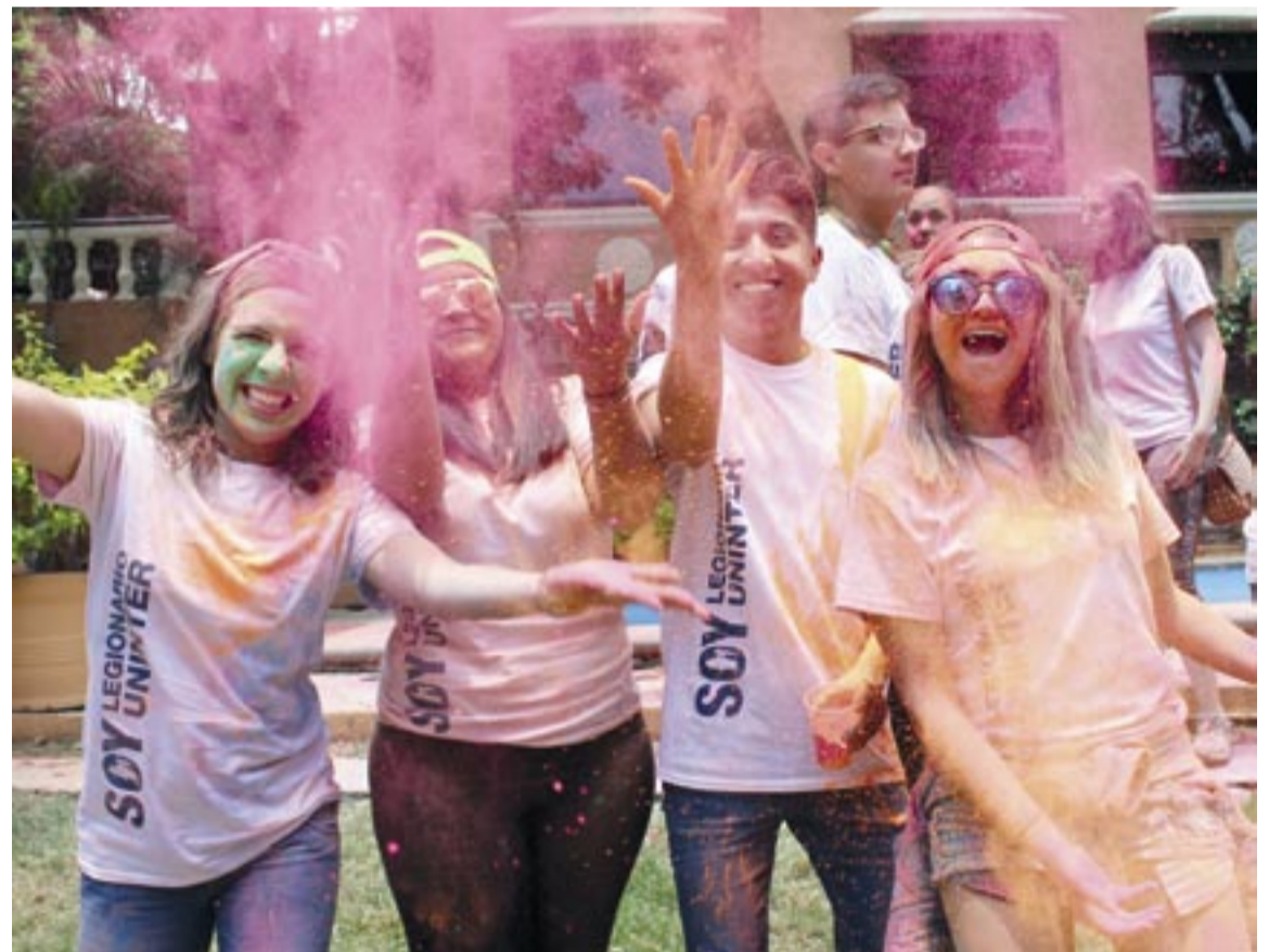
En todas partes el color estuvo presente.