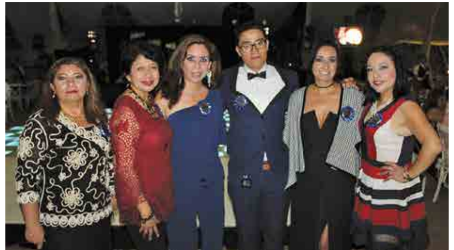
Equipo de ventas Imagen Médica.