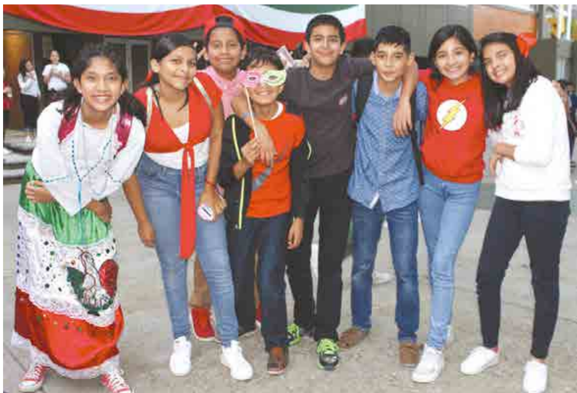
Felices de celebrar a México.