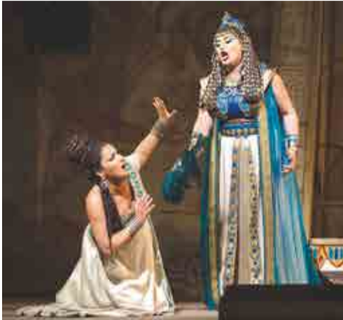
"Aída" de Giuseppe Verdi.