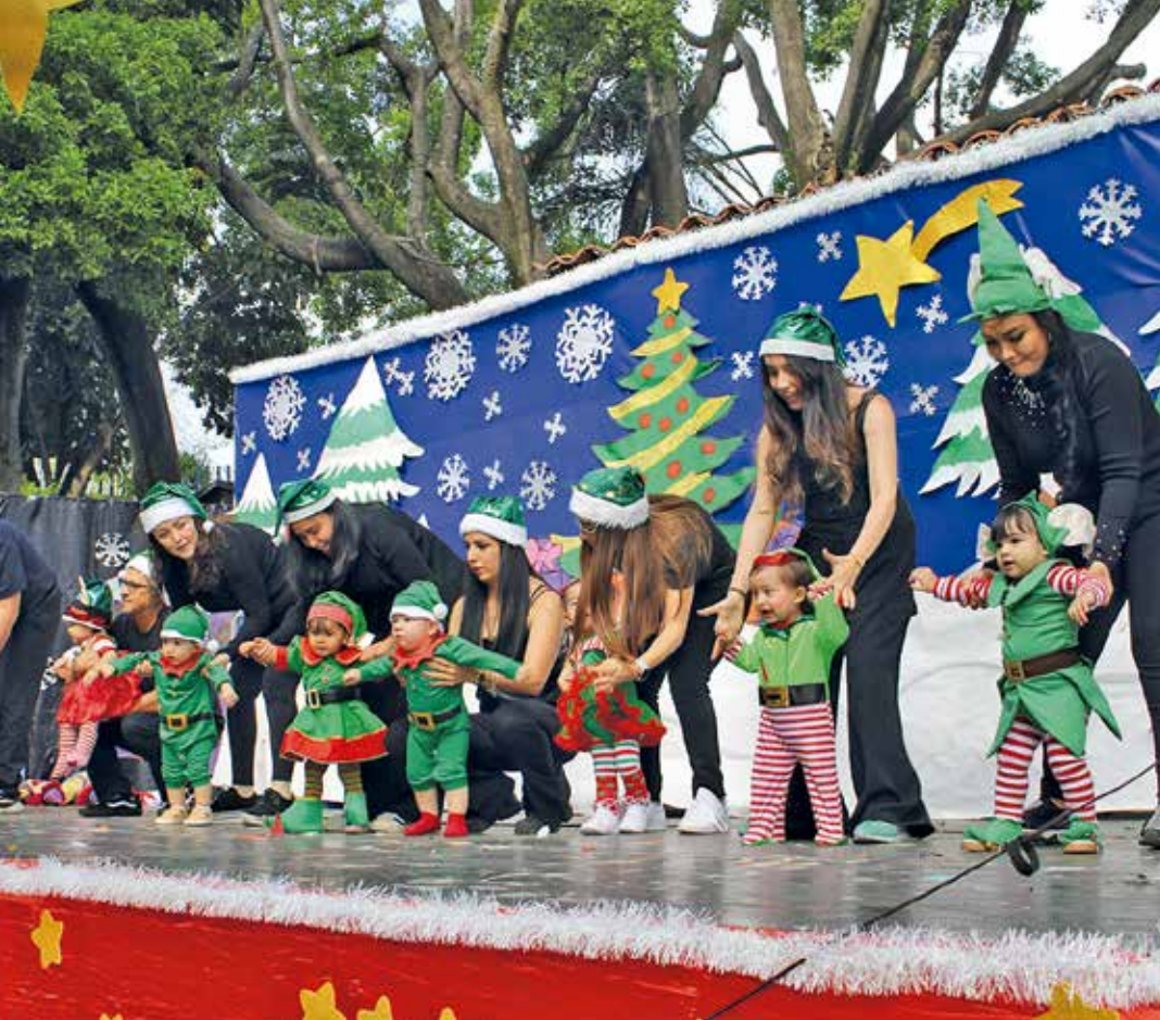
• Festival navideño.