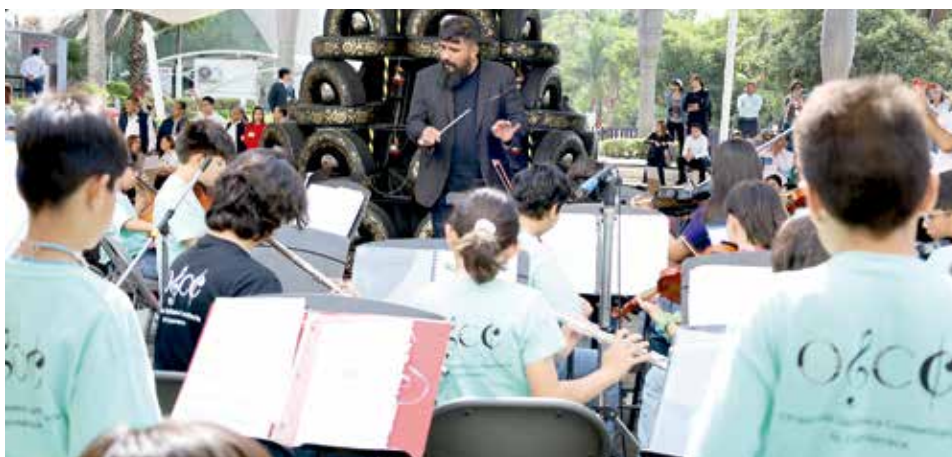
• Orquesta Sinfónica Comunitaria de Cuernavaca.

A la inauguración asistieron familias, aliados institucionales y comunidad creativa local, quienes reconocieron la relevancia de acercar propuestas artísticas innovadoras a los espacios de aprendizaje lúdico. Este proyecto fue posible gracias al apoyo de Costco Wholesale y Bose, quienes se sumaron para impulsar iniciativas culturales que fomentan la creatividad y el aprendizaje significativo.