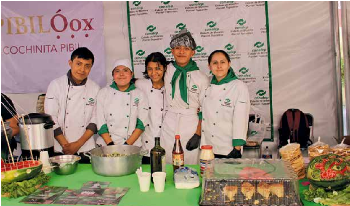
• Conalep Tepoztlán.