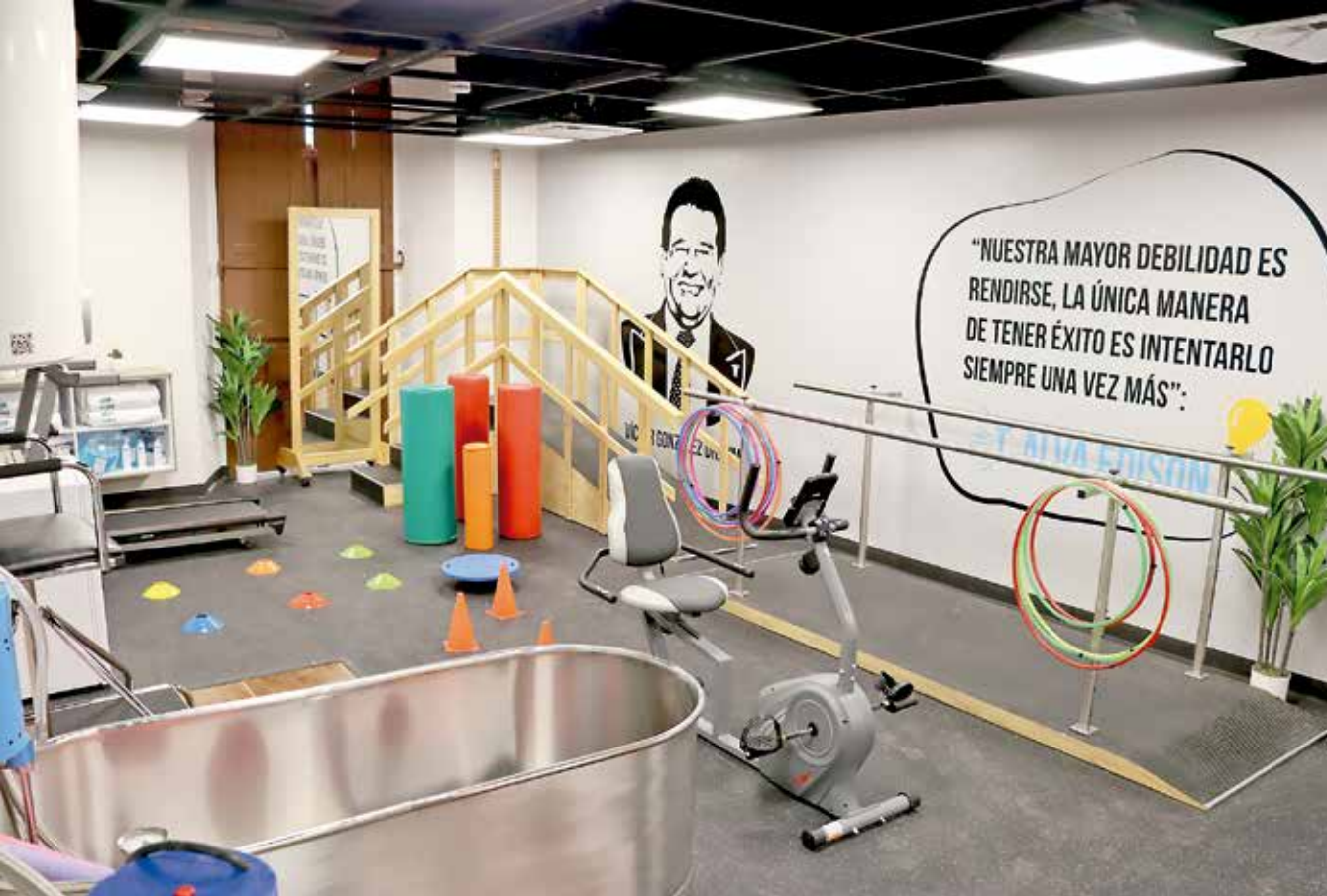
• Sala con tanque terapéutico.