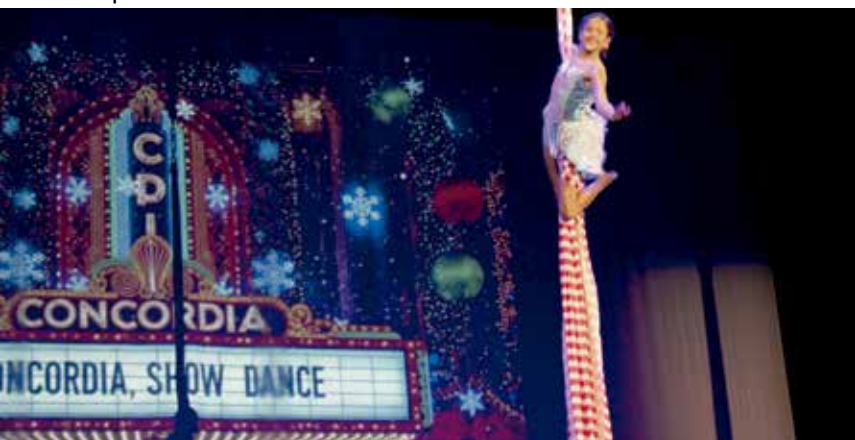
• Special guest: Concordia.