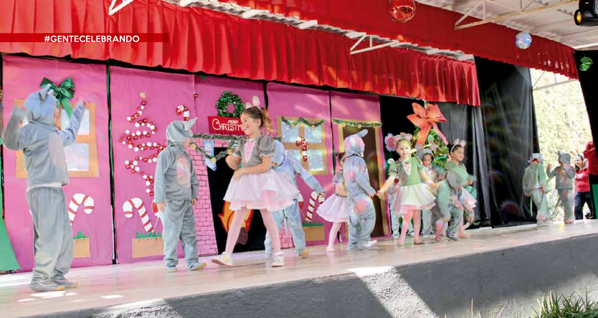
• Festival Navideño del Colegio Bilingüe Hellen Keller.