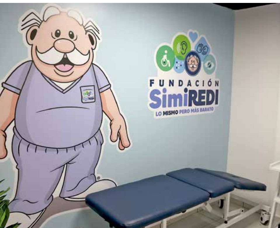
• Áreas de valoración.