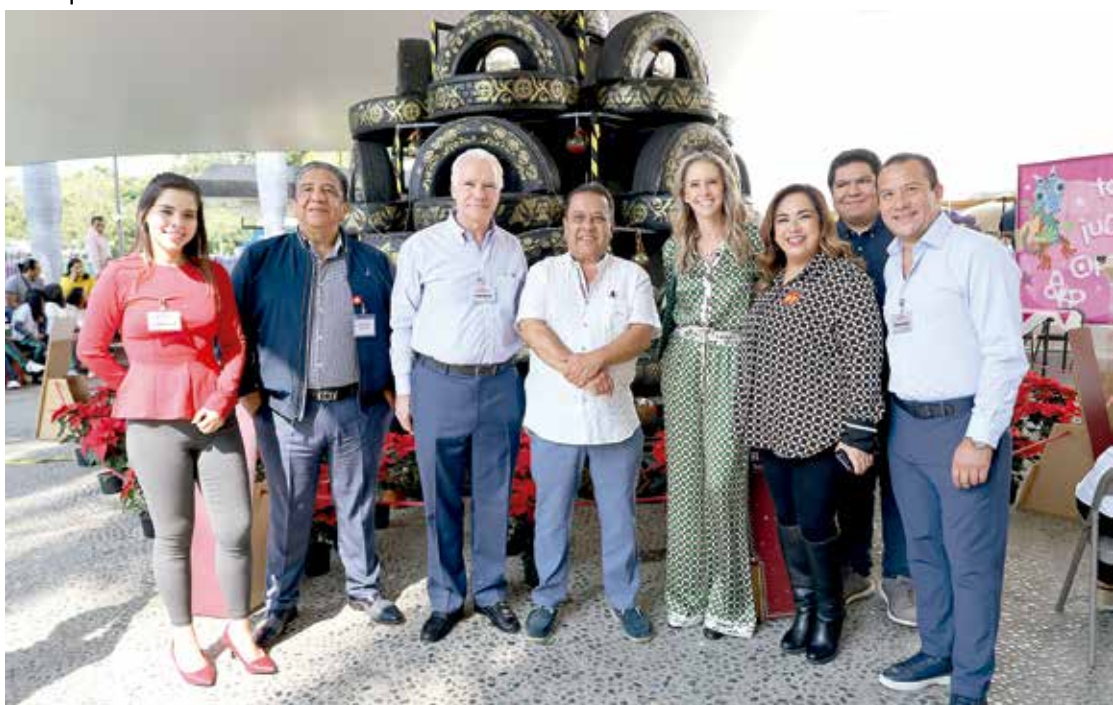
• El evento contó con invitados especiales.