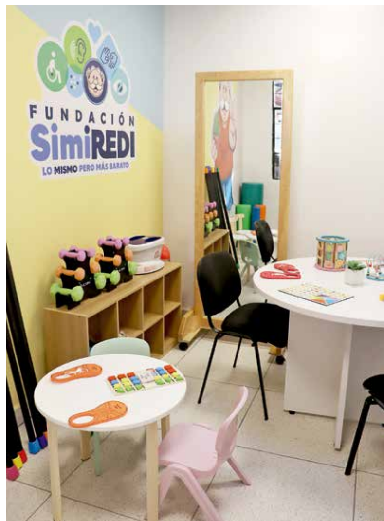
• Con costos accesibles, SimiREDI llega para ayudar a las personas.