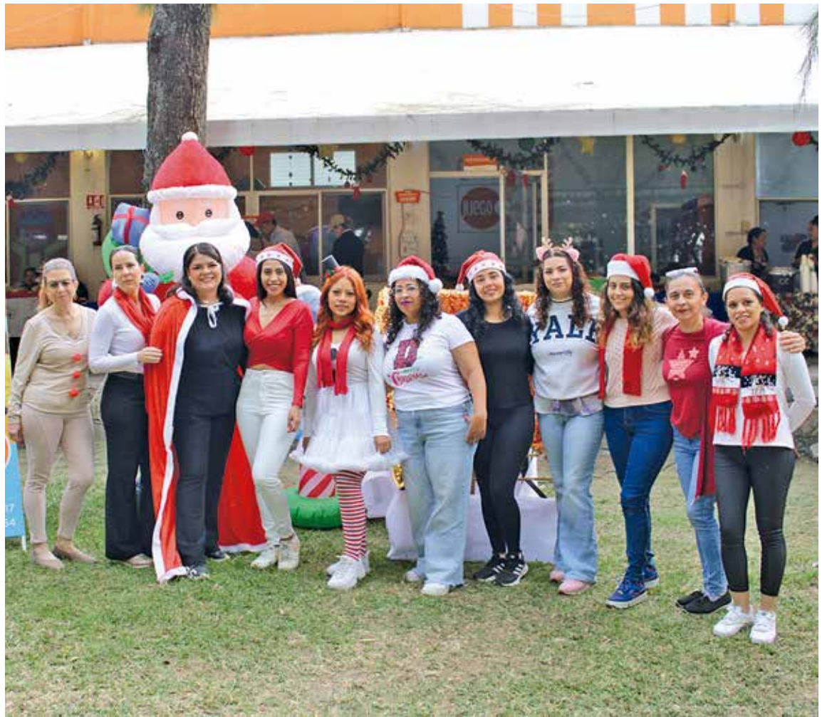
• Misses del GYMBOREE Cuernavaca.