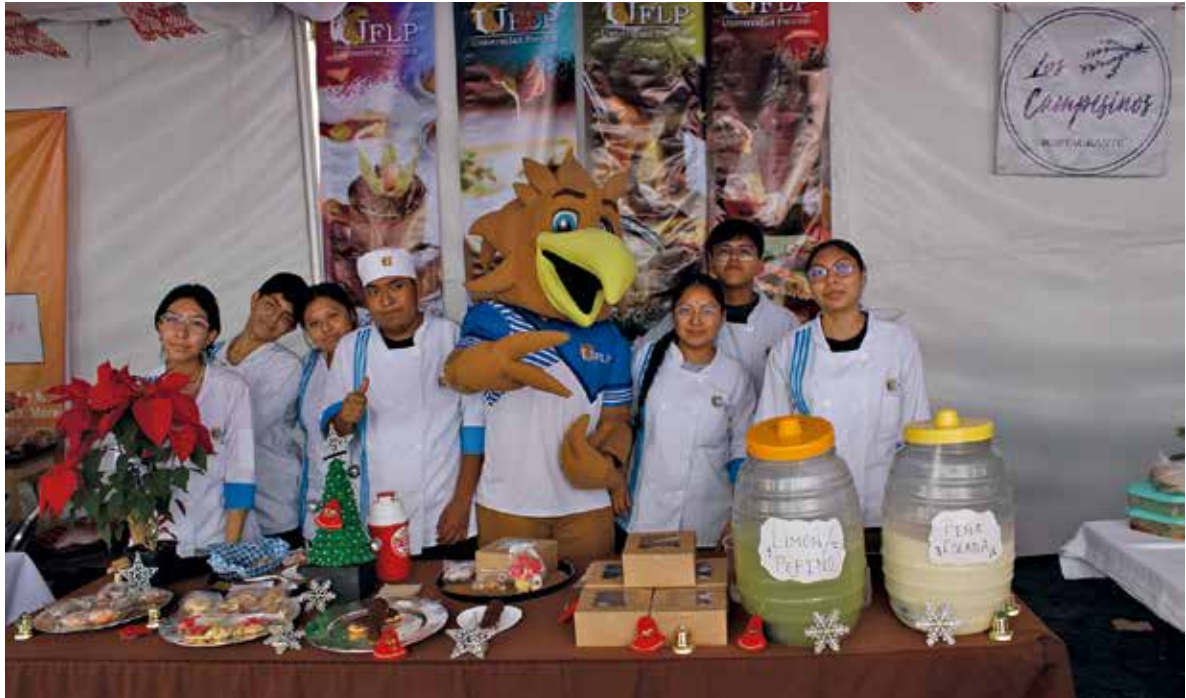
• Universidad Fray Luca Paccioli.

Perú, como país invitado y Celaya (Guana-juato), como municipio invitado, compartieron su riqueza cultural y gastronomía, logrando una fuerte conexión con los asistentes. Otro de los atractivos que marcó la edición número 14 de este gran festival fue el pabellón cultural de arte contemporáneo, donde creadores morelenses mostraron sus más recientes obras; espacio coordinado por el artista internacional Cisco Jiménez.