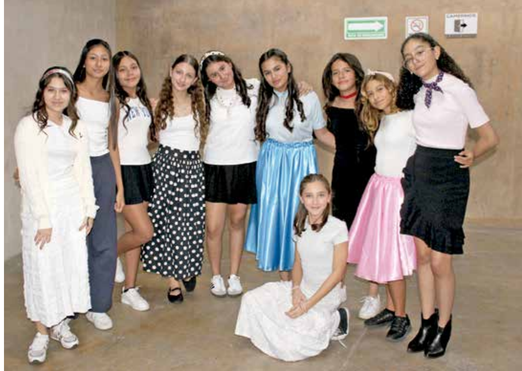
• Alumnas de Secundaria.