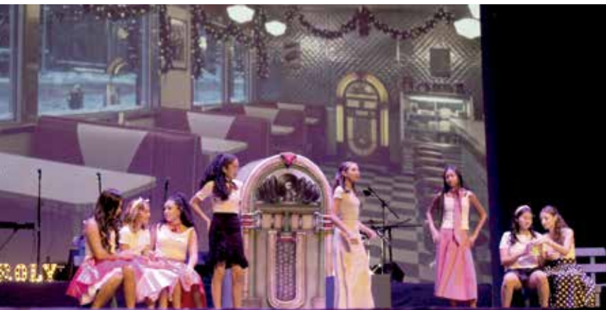
• Special version of Grease.