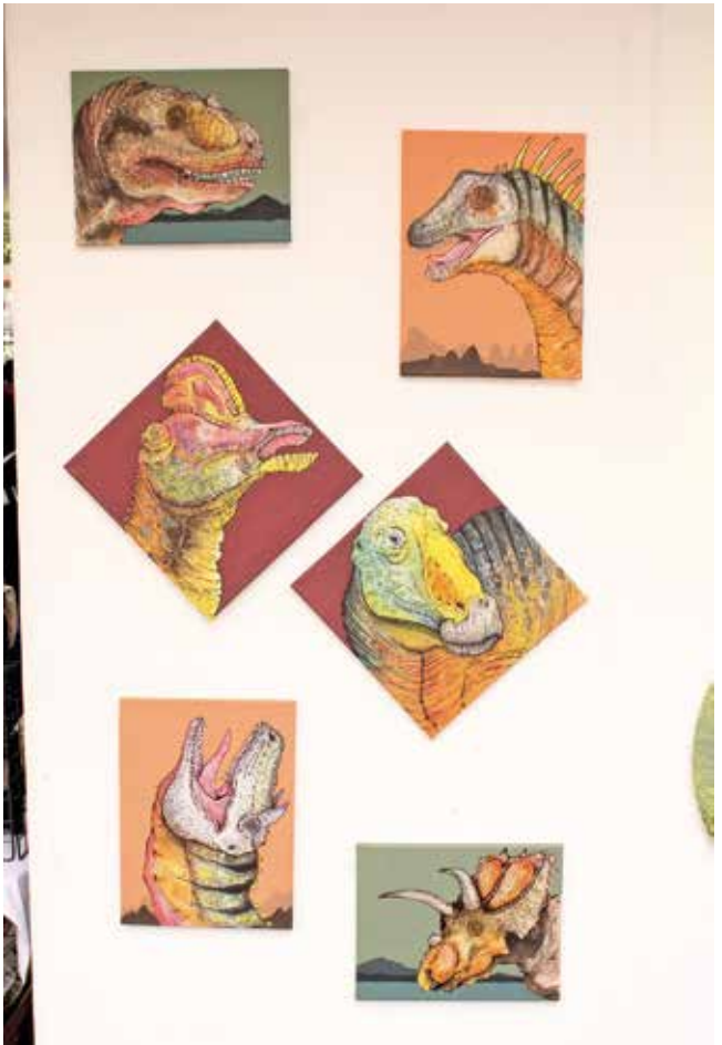
• Arte contemporáneo.

Perú, como país invitado y Celaya (Guana-juato), como municipio invitado, compartieron su riqueza cultural y gastronomía, logrando una fuerte conexión con los asistentes. Otro de los atractivos que marcó la edición número 14 de este gran festival fue el pabellón cultural de arte contemporáneo, donde creadores morelenses mostraron sus más recientes obras; espacio coordinado por el artista internacional Cisco Jiménez.