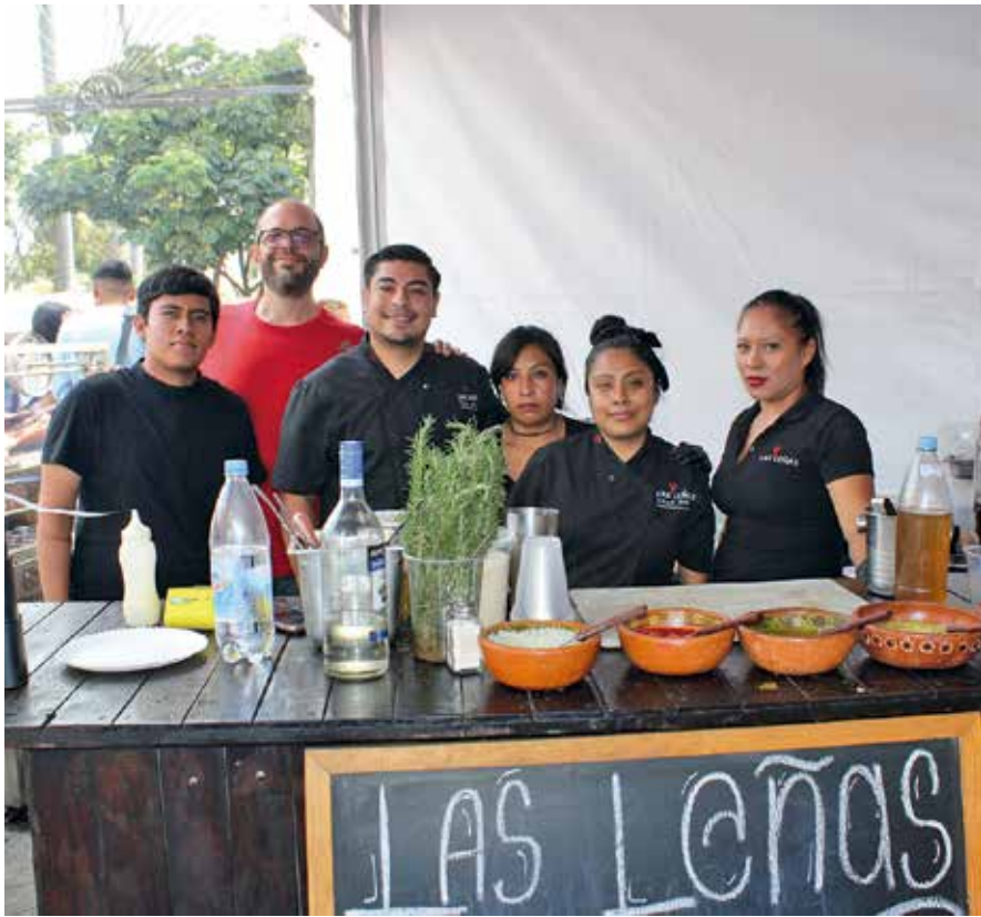
• Las Leñas.