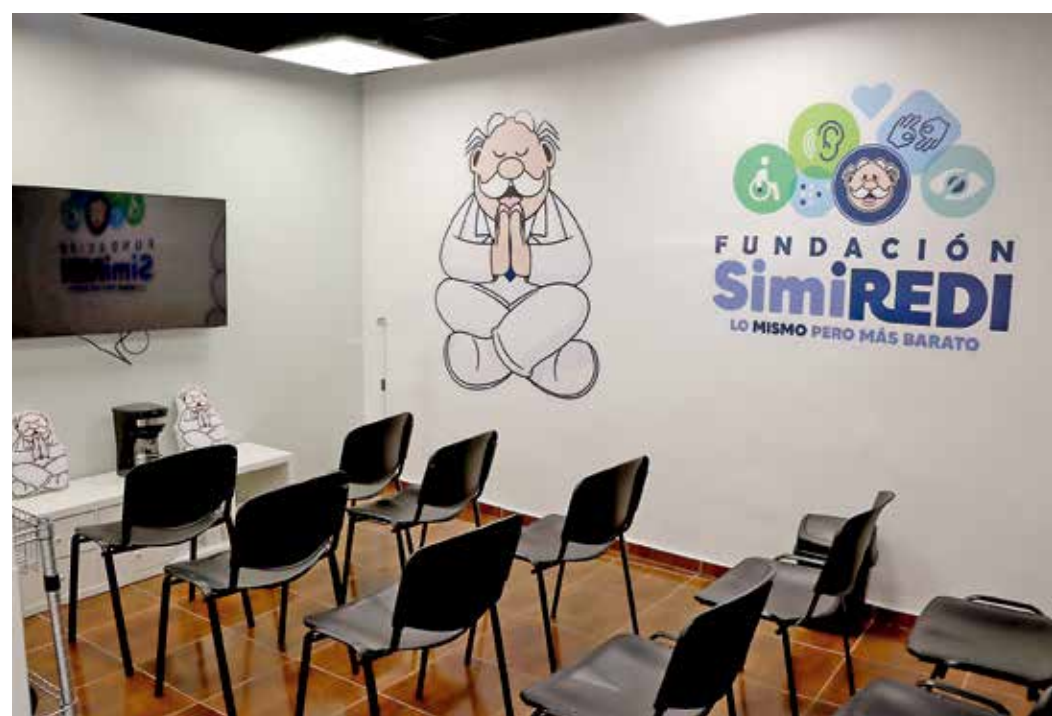
• Instalaciones de primer nivel.

Las instalaciones de la Fundación están ubicadas en avenida Morelos número 215, en un horario de 08:00 a 17:00 horas, en el municipio de Cuernavaca.