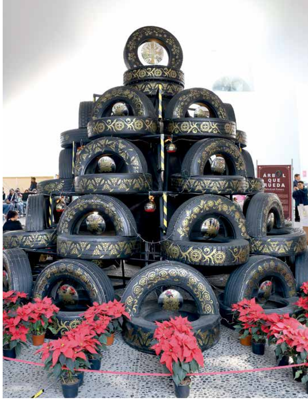
• Inauguración del Árbol que Rueda.