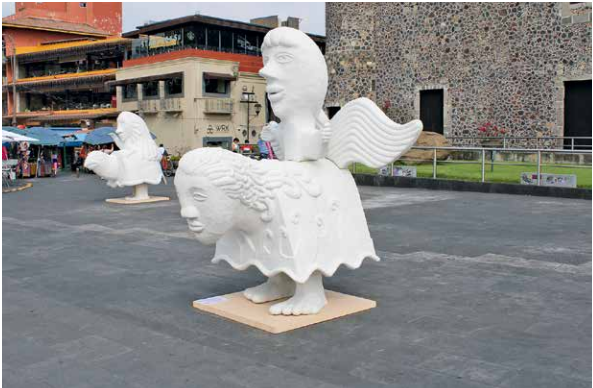
• Escultura del pabellón cultural de arte contemporáneo.