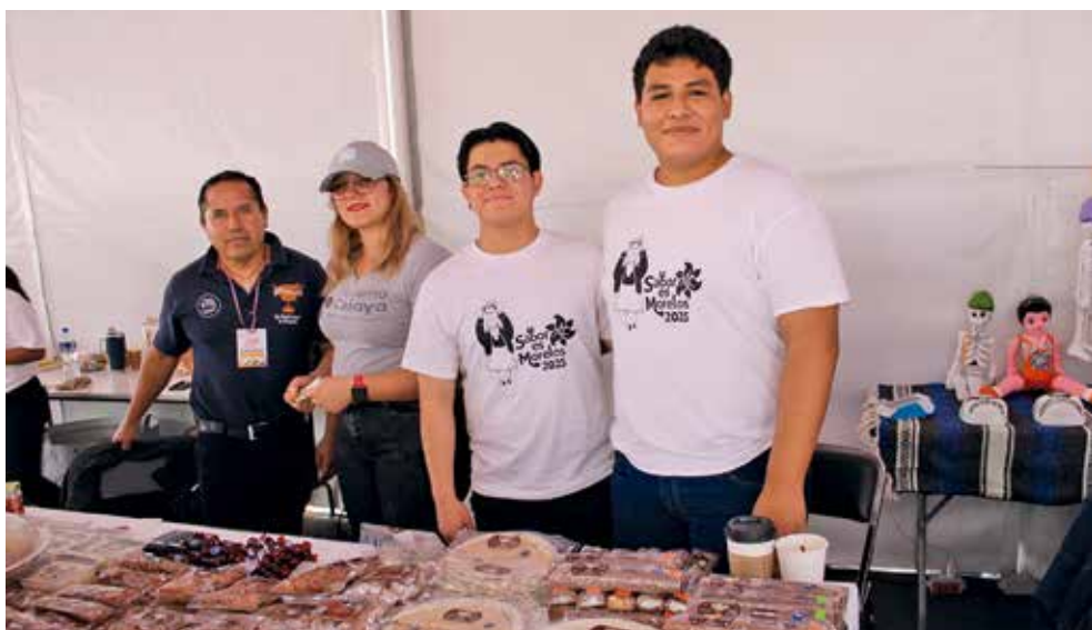
• Delegación de Celaya, Guanajuato.