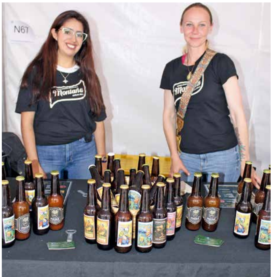
• Cerveza de Montaña.

Este maravilloso evento puso de manifiesto que es uno de los festivales gastronómicos más importantes de México, con gran asistencia, sabores internacionales, tradición mexicana y respuesta de la población que superó las expectativas de expositores y organizadores. Más de 300 stands reunieron a chefs, cocineras tradicionales, artesanos y productores.