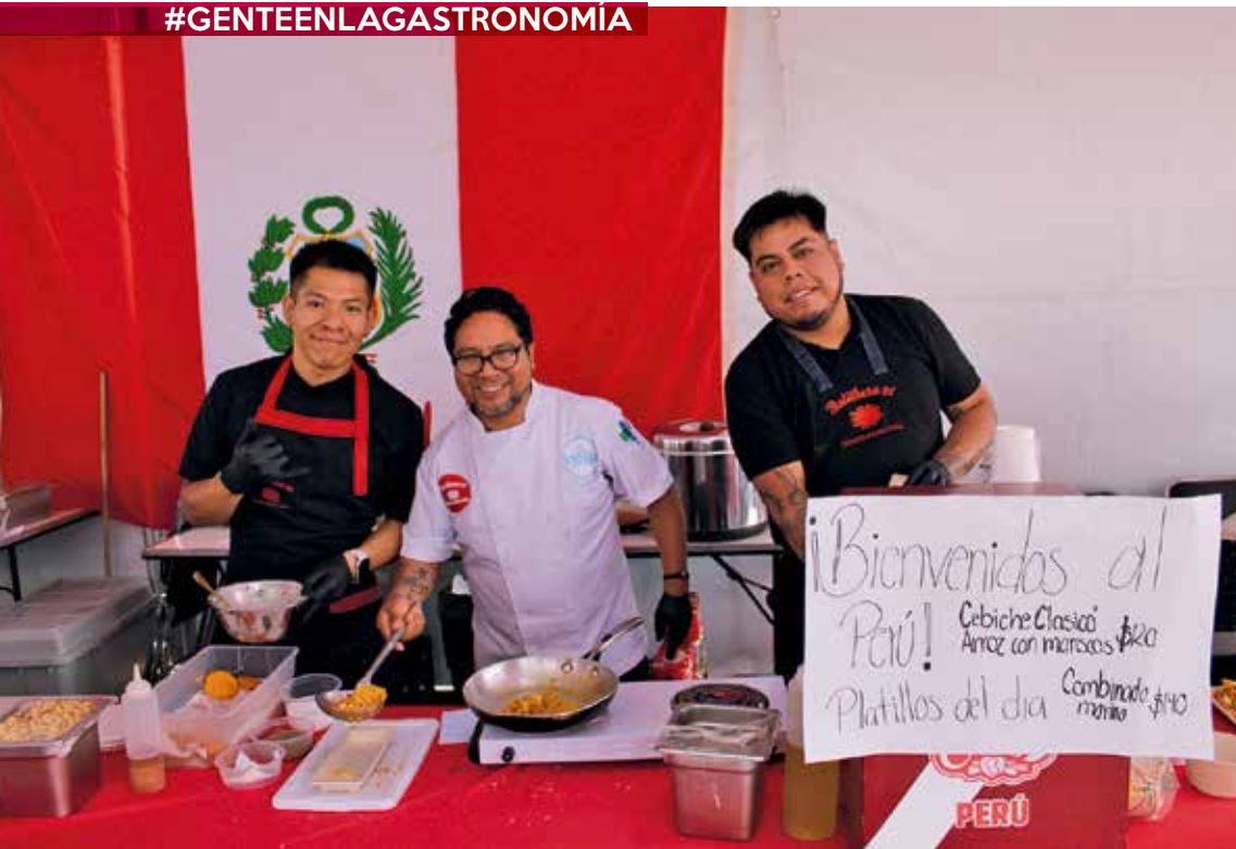
• Delegación de Perú.