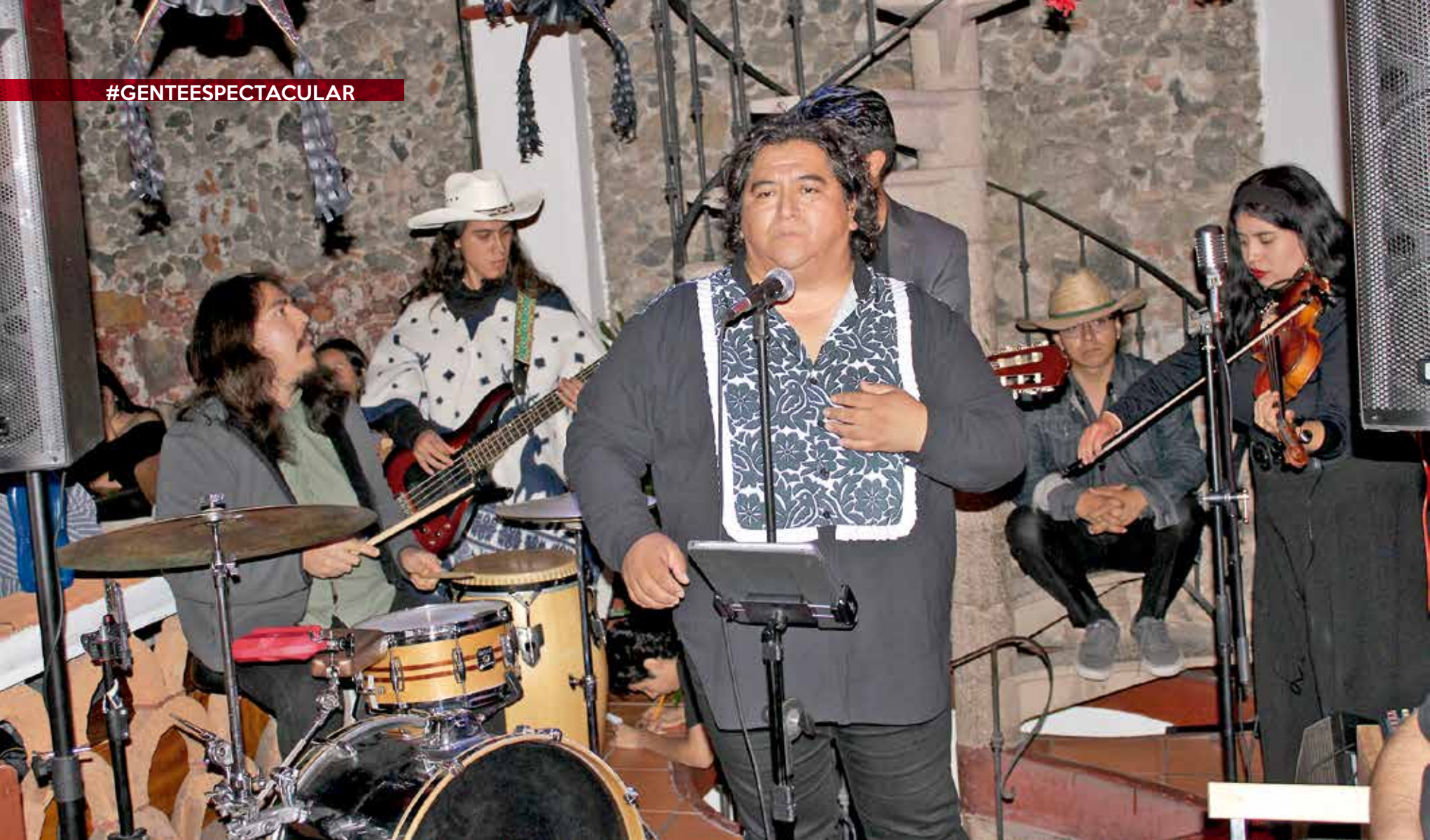
• Concierto de Robín Reza y La Dolorosa.