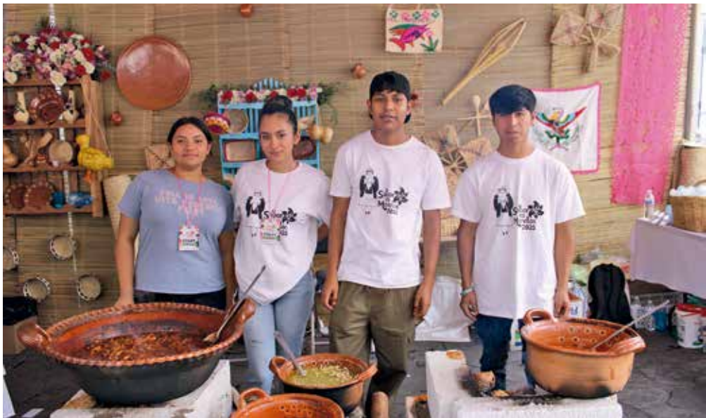
• Staff de Emiliano's, Iguanas Green's y Casa Tikal.