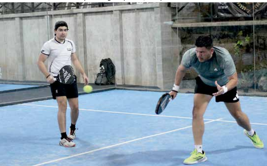
• Final del juego 3ra.

El torneo reunió a 50 parejas, quienes compitieron en distintas categorías, quienes demostraron talento, pasión y espíritu deportivo en cada uno de los encuentros. Durante la jornada se vivió un ambiente de compañerismo, energía positiva y apoyo entre jugadores, familias y asistentes.