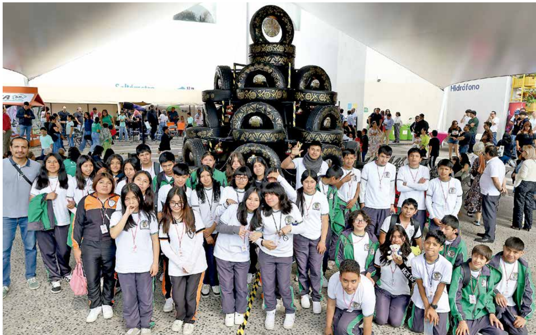
• Alumnos de diferentes escuelas.

convirtiéndose en un atractivo visual y educativo para niñas, niños y familias que visiten el museo durante esta temporada.