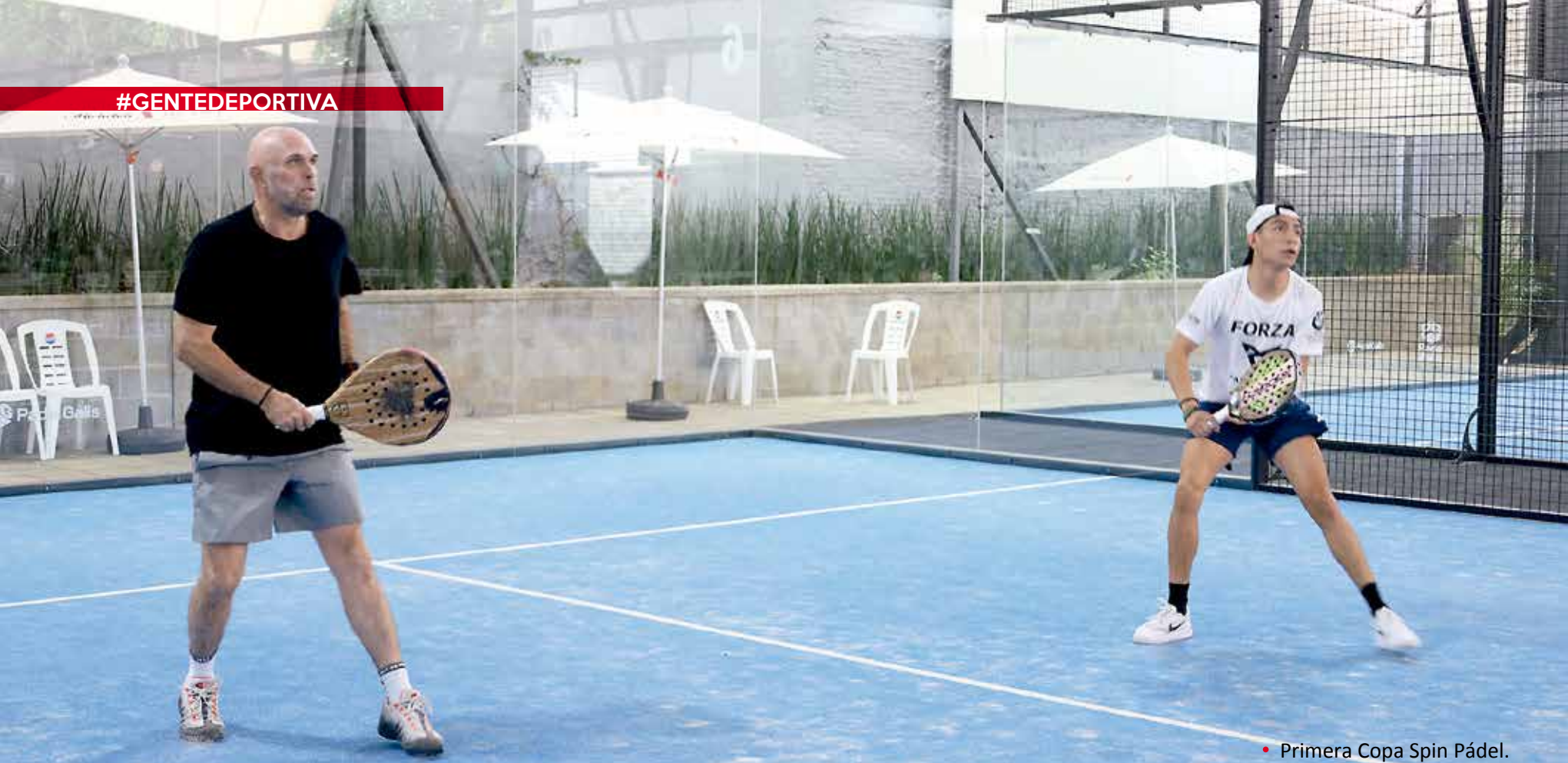
• Primera Copa Spin Pádel.