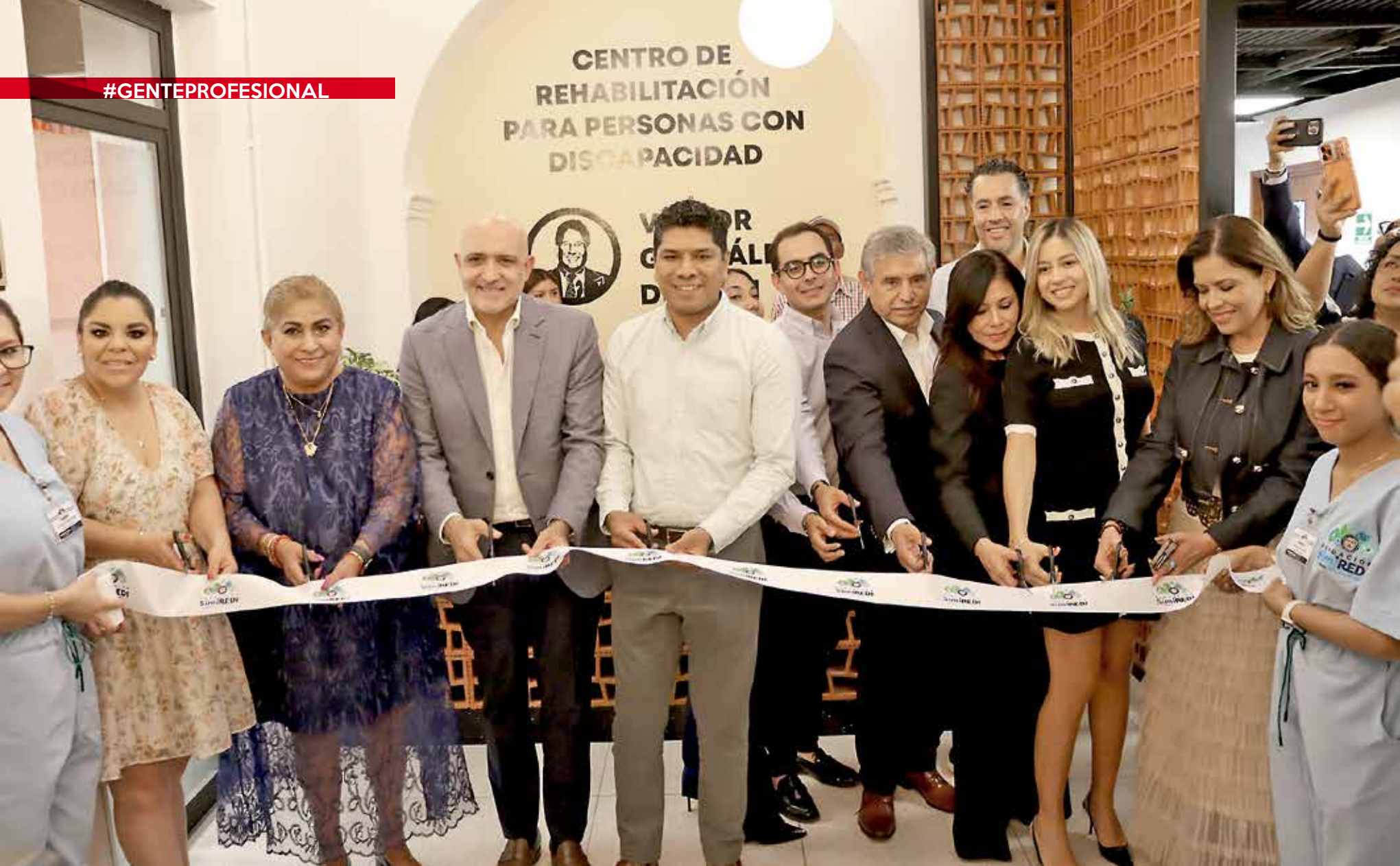
• Corte inaugural de la Fundación SimiREDI.