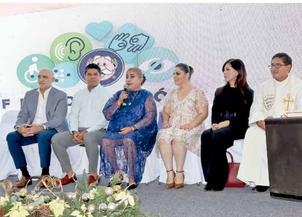
• Representantes de los gobiernos Municipal y Estatal se dieron cita.

ACCESO A LA SALUD INTEGRAL DE LAS Y LOS MORELENSES