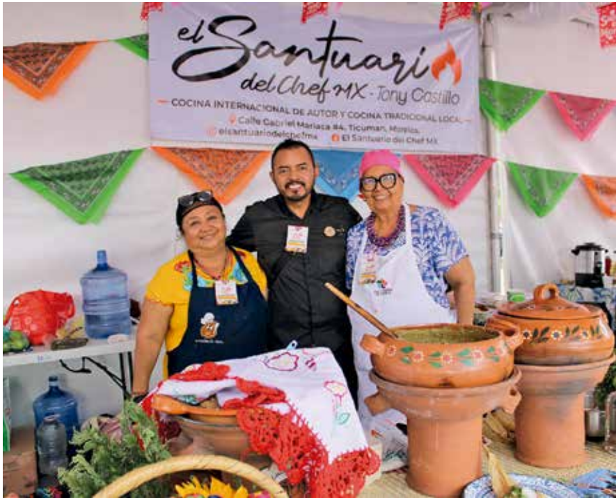
• El Santuario.