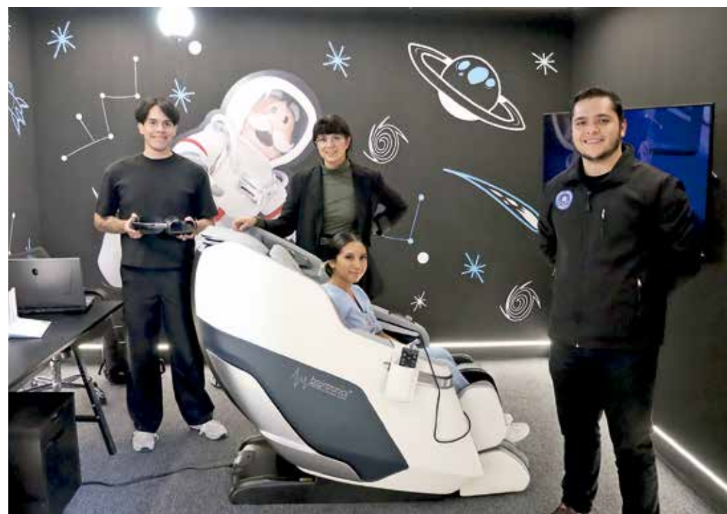
• La realidad virtual llega a Morelos de la mano del Dr. Simi.