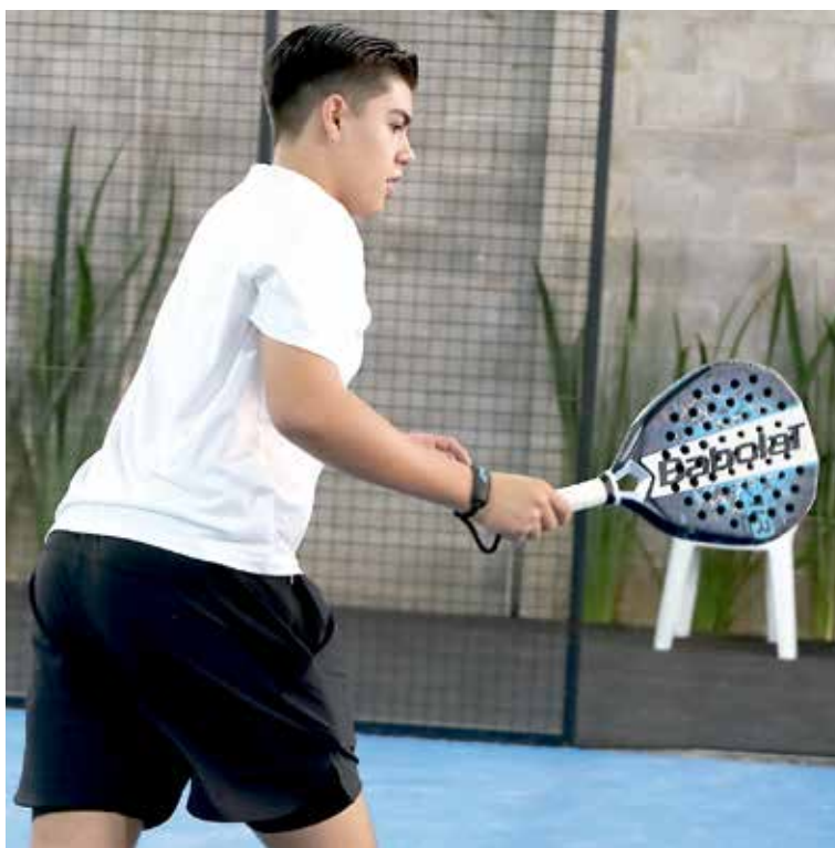
• Calentamiento previo al partido.

Con gran éxito se llevó a cabo la Primera Copa Spin Pádel desde las instalaciones de Pádel Cygnus, un evento que tuvo como principal objetivo promover el deporte, la sana competencia y la convivencia familiar.