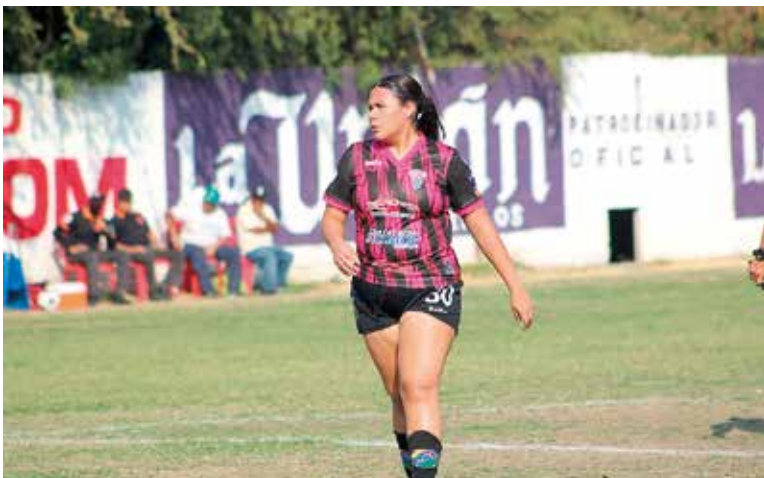
LAS CAUDILLAS DE Morelos recibirán al Halcones Zúñiga Soccer Club.