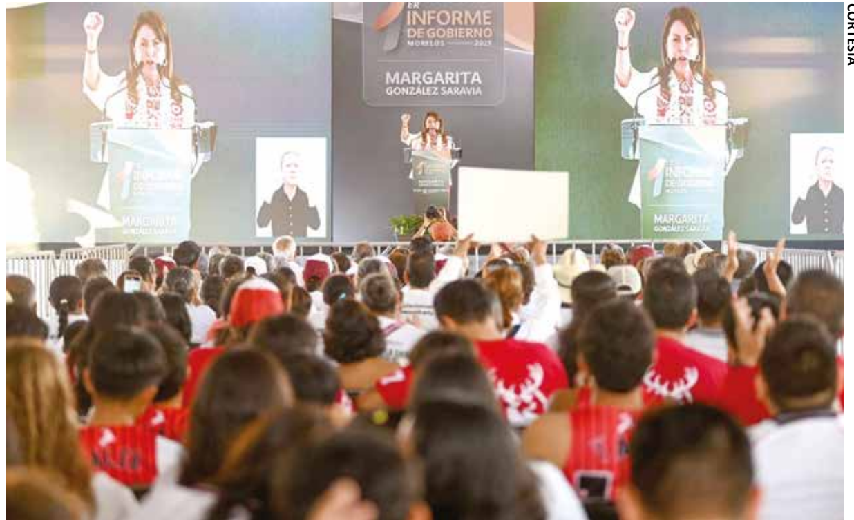
MARGARITA GONZÁLEZ SARAVIA finalizó en Jojutla el primer día de los informes regionales con motivo del primer año de su administración.

La gobernadora centró su mensaje en la atención a las necesidades sociales mediante trabajo en territorio, diálogo permanente y transparencia, bajo la premisa de que "ordenar la casa es transformar Morelos".