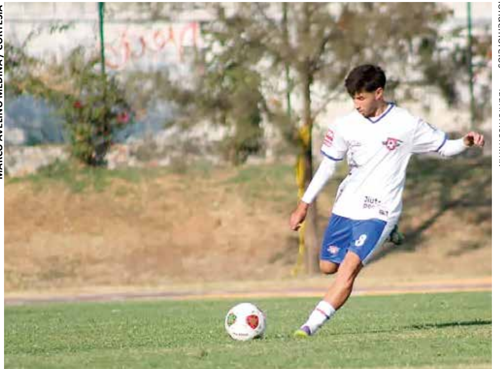
EL ATLÉTICO REAL Morelos 27 enfrentará, en el estadio Moisés Galindo de Jiutepec, al invicto Chineros de Yauatepec.