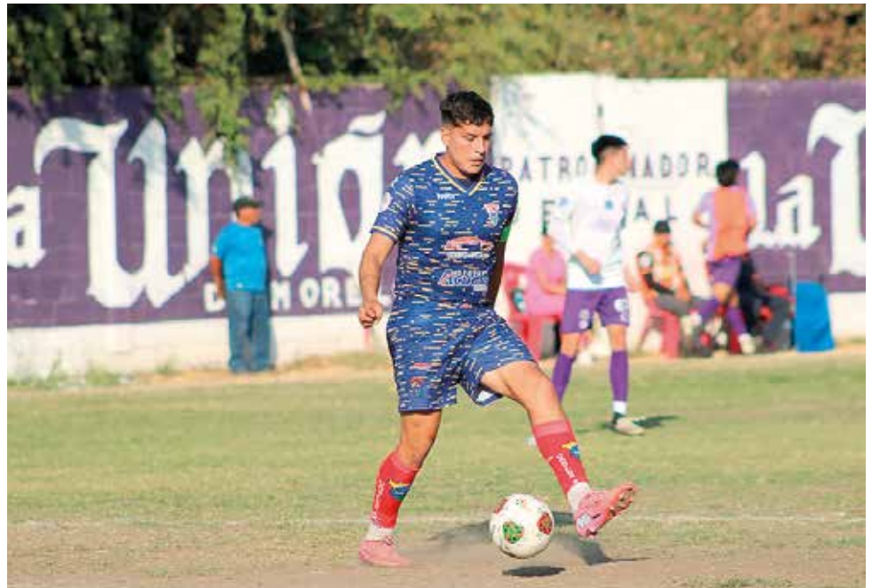
EL CAUDILLOS DE Morelos varonil visitará a los Alebrijes CDMX.