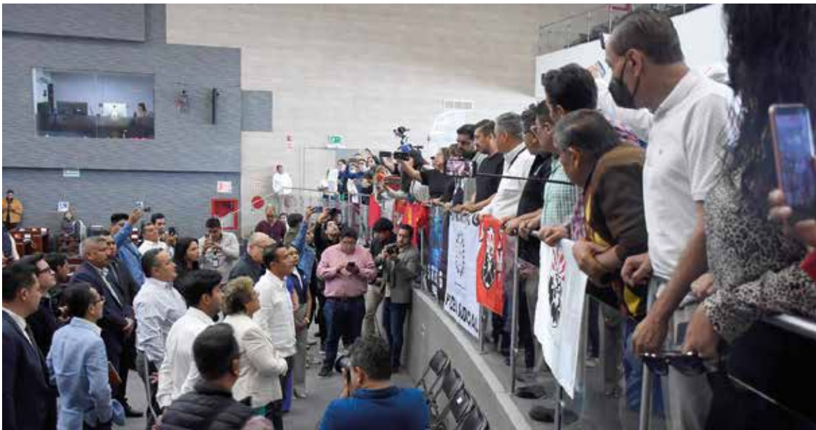
DIPUTADOS DIALOGARON CON miembros de organizaciones sindicales que acudieron a la sesión legislativa de ayer.