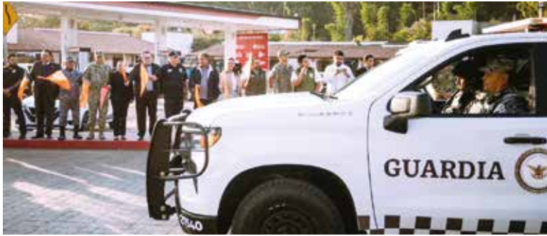
LA SÍNDICA PARTICIPÓ en el banderazo de inicio del operativo de seguridad del carnaval de Tepoztlán.

» SE BUSCA garantizar la seguridad durante el carnaval de Tepoztlán