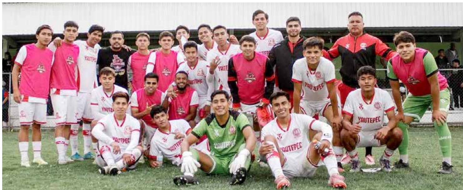
CHINELOS YAUTEPEC RECIBIRÁ a Deportivo Metepec en el campo deportivo Yautepec.

EN LA SEGUNDA División, el Zacatepec FC quiere meterse a cuartos de final y, para ello, deberá vencer a los Alacranes de Durango.