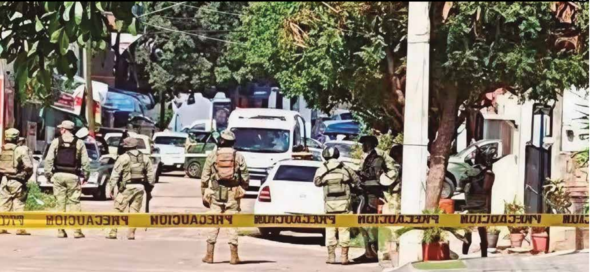
EL ATAQUE FUE perpetrado sobre la carretera Cuernavaca-Taxco, la tarde del viernes.