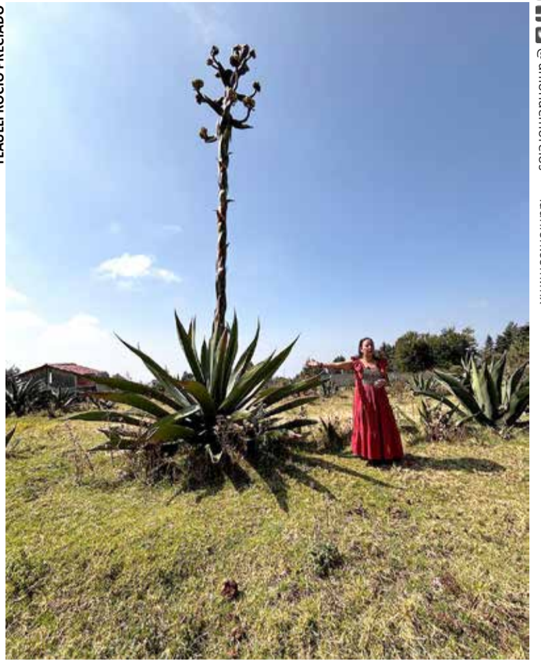
LOS PROCESOS DE producción de pulque y otros productos a base de maguey se han convertido en un atractivo para las nuevas generaciones.

ción de espacios con actividades sustentables y convivencia de las familias”.