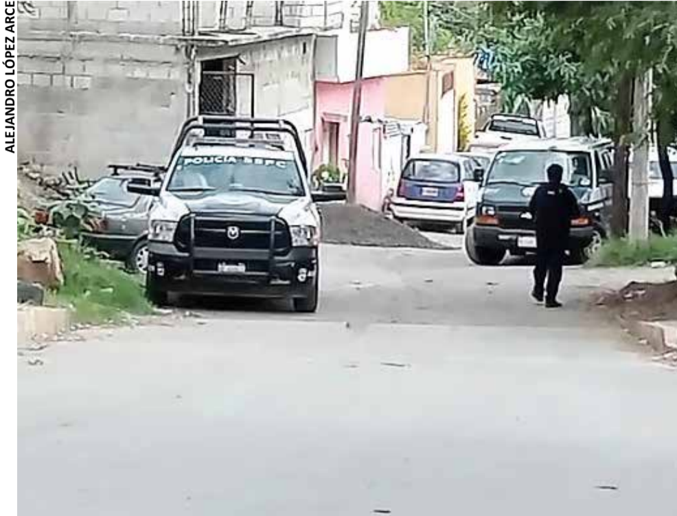
LA VÍCTIMA NO fue identificada en el lugar del ataque.

» FUE ASESINADO a balazos en un predio que se localiza en la colonia Benito Juárez; se desconoce su identidad