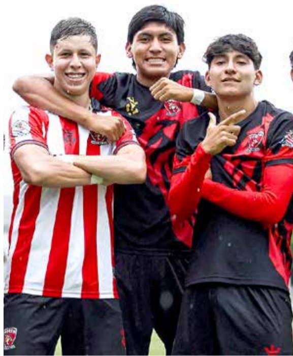
ATLÉTICO CUERNAVACA VISITARÁ a Aztecas A.M.F., a las 12:00 horas, en el Deportivo Francisco Zarco de la Ciudad de México.