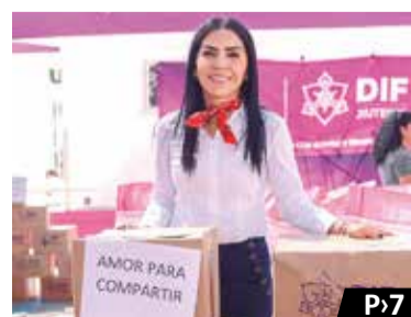
Entrega DIF Jiutepec más de 450 despensas a grupos vulnerables P.7

Alta demanda en rentas vacacionales impulsa al sector inmobiliario