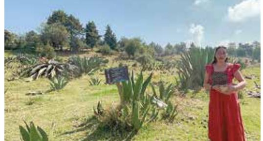
PRODUCTORES DE MAGUEY y pulque ofrecen recorridos para conocer el proceso de elaboración de la milenaria bebida, como parte de los proyectos agroturísticos que apoya la Sedagro.