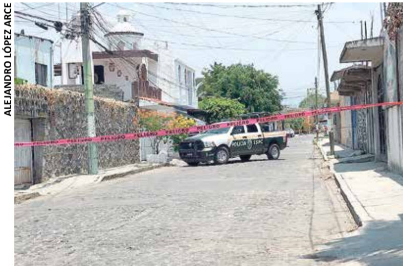
EL PROPIETARIO DEL inmueble dijo desconocer el porqué de la agresión.

Delinquentes dispararon contra una casa que se localiza en la colonia Lázaro Cárdenas del Río de Cuernavaca, la madrugada del viernes. De acuerdo con información policial, los hechos ocurrieron alrededor de las 02:00 horas sobre la calle Álvaro Obregón, esquina con 24 de Febrero. Al respecto, fuentes policiales dieron a conocer que un vecino de la citada colonia reportó a la Policía que escuchó disparos y, al salir de su domicilio, vio que el portón de su vivienda tenía varios impactos de bala.