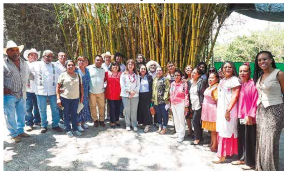
LA JEFA DEL Ejecutivo atendió a representantes de comunidades originarias.

» La gobernadora sostuvo un encuentro con integrantes del Consejo Consultivo de las Comunidades Indígenas y Afromexicanas P.2