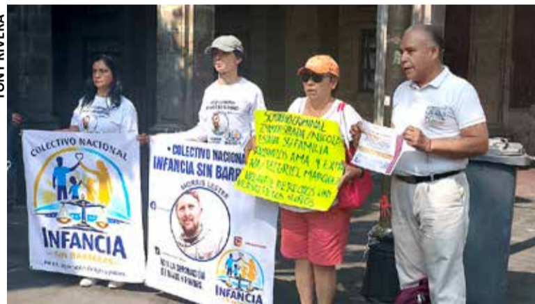
LOS MANIFESTANTES DIJERON tener documentados 312 casos en Morelos en los que los jueces habrían perjudicado notoriamente a los papás.