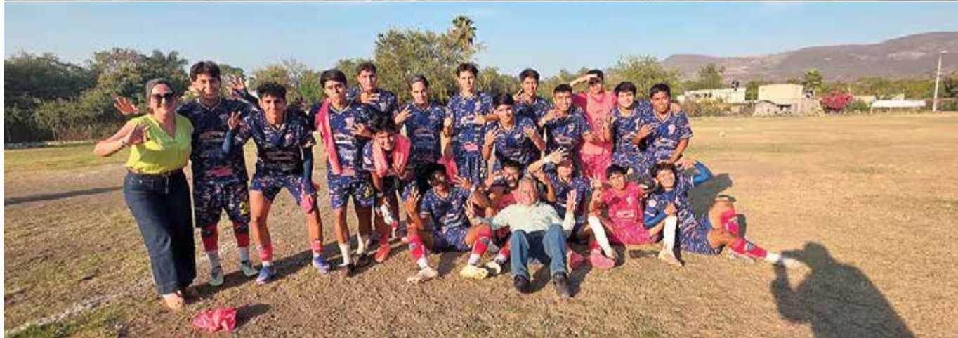
LOS CAUDILLOS DE Morelos cerrarán el torneo recibiendo al Colegio Once México.