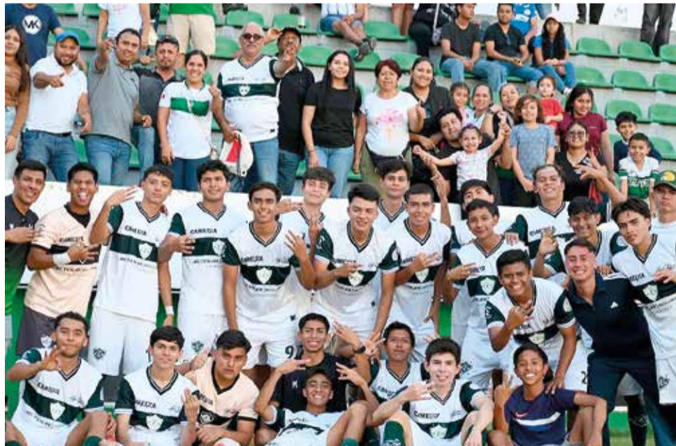
SELVA CAÑERA, AUNQUE no calificó a la liguilla, terminó bien el torneo.

Con derbi morelense y buscando terminar la fase regular invicto, Chinelos Yautepec visita hoy, a las cuatro de la tarde, a Selva Cañera en el esta-