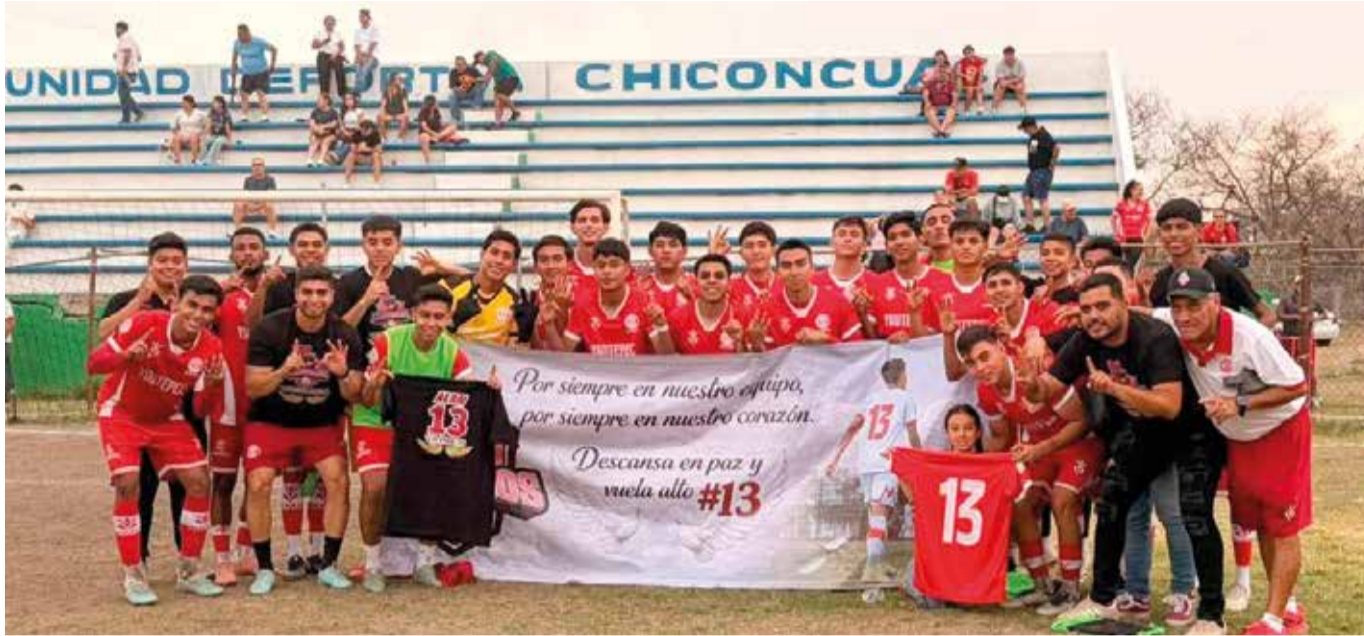
LOS CHINELOS SON líderes del sector con 82 puntos y buscan terminar como el primer lugar nacional por porcentaje de efectividad en puntos.

» CON DERBI morelense entre Chinelos Yautepec y Selva Cañera, culmina la actividad del Grupo 8; en Chiconcuac, Caudillos de Morelos recibe al Colegio Once México