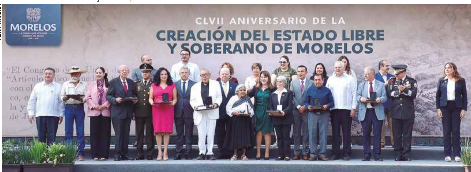
DURANTE LA CEREMONIA, la gobernadora entregó la Venera "José María Morelos y Pavón, Morelenses de Excelencia".