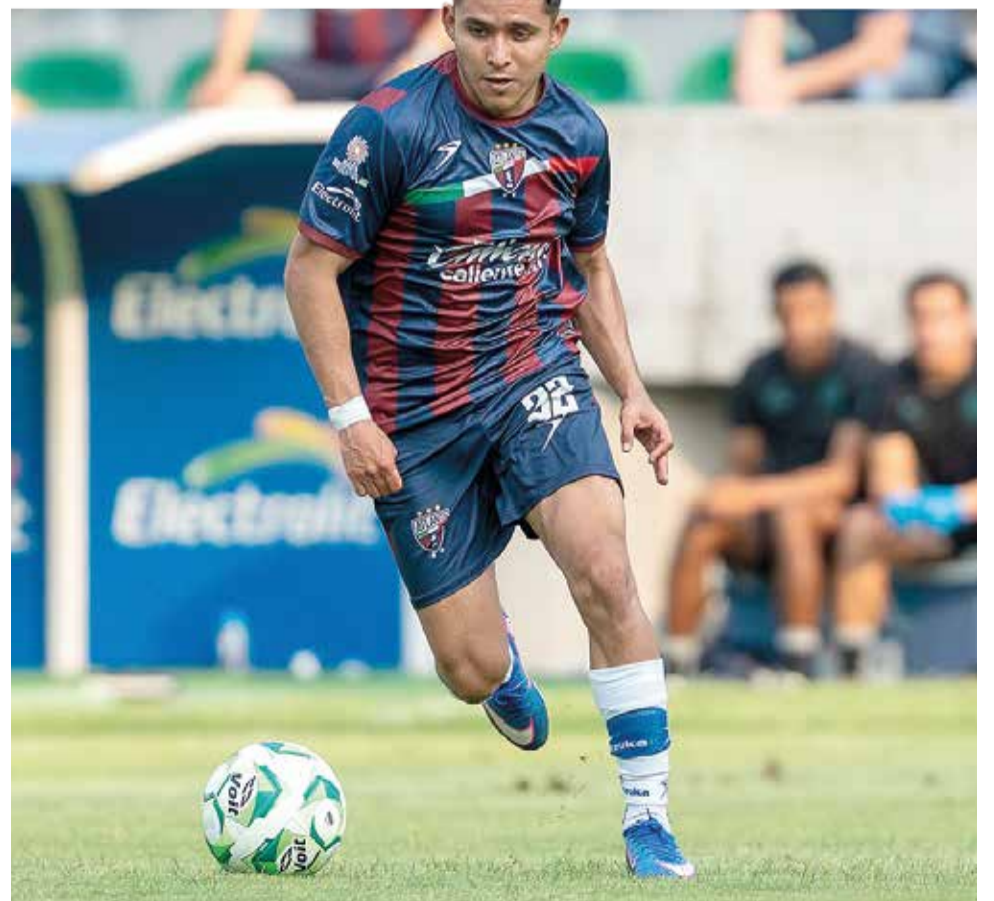
EL PARTIDO DE ayer podría ser el último que el Atlante juegue como local en Morelos.