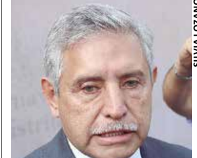
EL EDIL DESTACÓ que no se puede considerar incrementar el costo si no se dota del recurso a la ciudadanía.

» CON LLAMADO A LA UNIDAD Y AL DESARROLLO