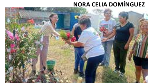
ESTE VIERNES REALIZARON una ceremonia simbólica en honor a las personas exhumadas.

Durante esta quinta fase, iniciada el pasado 16 de marzo, se incorporó la técnica de dacti-