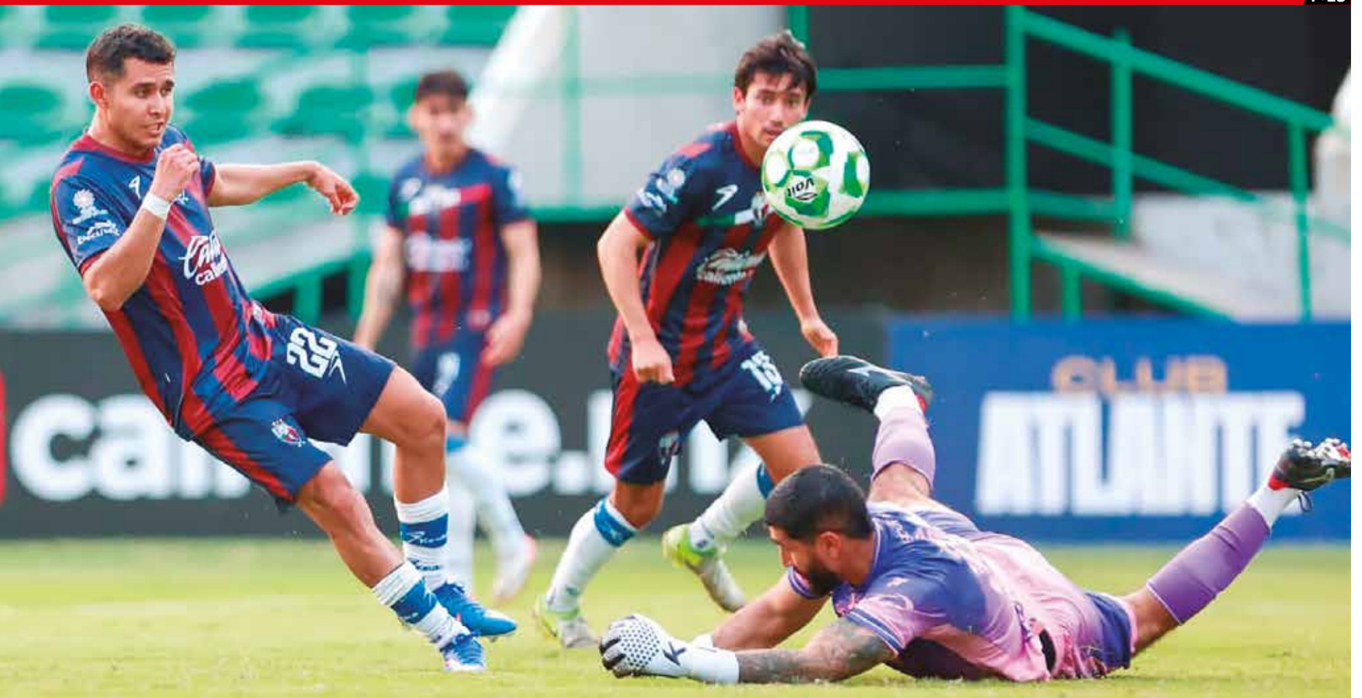
EL DUELO SE disputó en el estadio "Agustín 'Coruco' Díaz" de Zacatepec, la tarde del viernes.