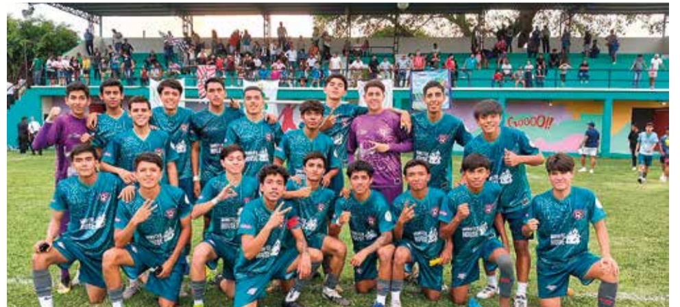
MAÑANA, EL ATLÉTICO Real Morelos 27 se despide del torneo visitando al Mineros Zacatecas CDMX.