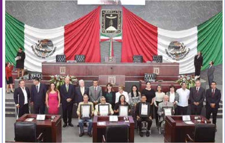
COMO PARTE DE la ceremonia, entregaron la Medalla de Honor del Congreso del Estado de Morelos 2026.

INAUGURA MGS EXPOSICIÓN "NACER ENTRE ESPINAS, CREACIÓN DEL ESTADO DE MORELOS" P.2