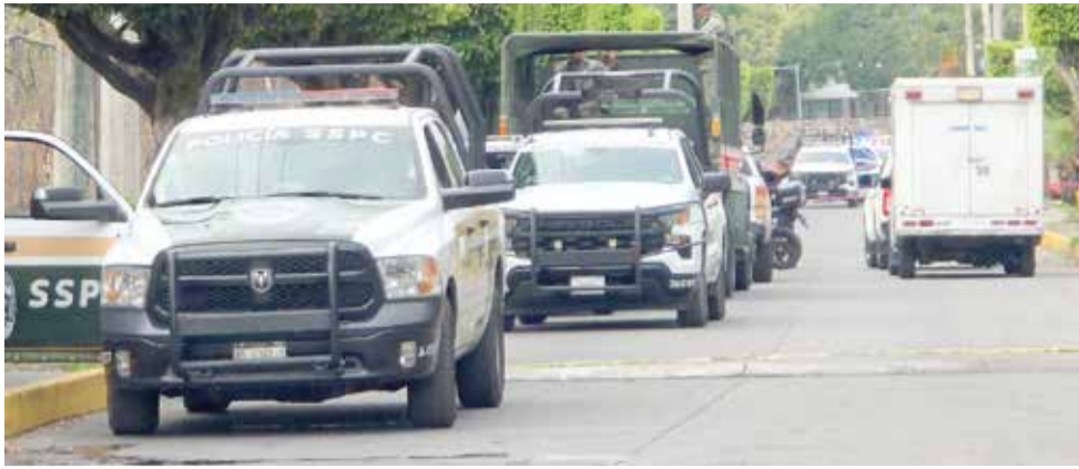
ÉSTE FUE EL segundo homicidio ocurrido en el municipio de Temixco en 12 horas.