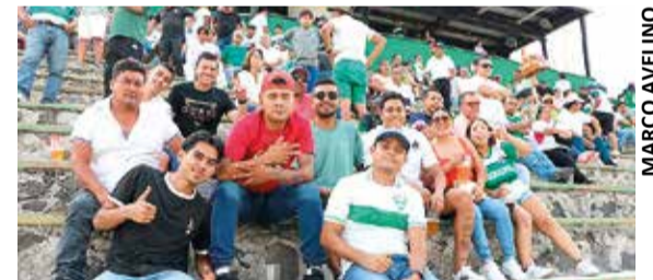
EL PÚBLICO SE hizo presente para apoyar a los Cañeros.