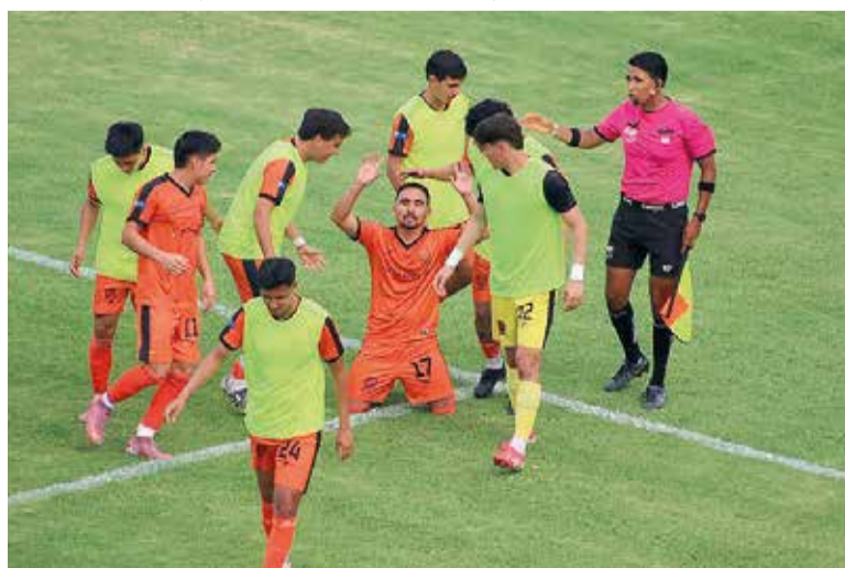
LA VISITA SE llevó un empate con sabor a victoria.