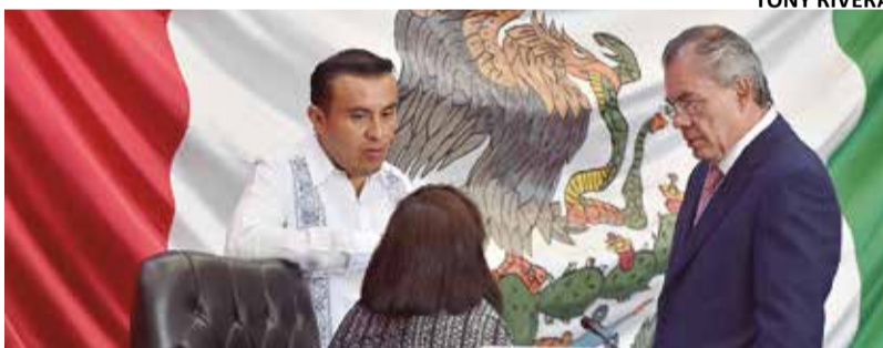
EL CONGRESO MORELENSE aprobó la reforma electoral federal.