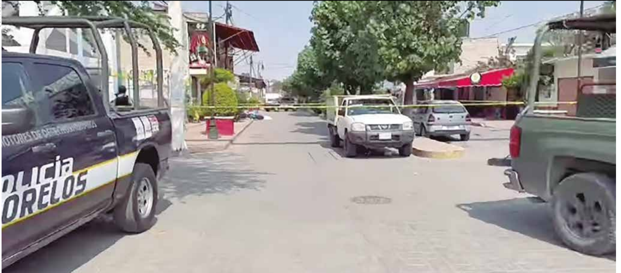
LA VÍCTIMA FUE atacada sobre la calle Emiliano Zapata, la mañana del miércoles. Resultó con varios impactos de bala en el cuerpo.