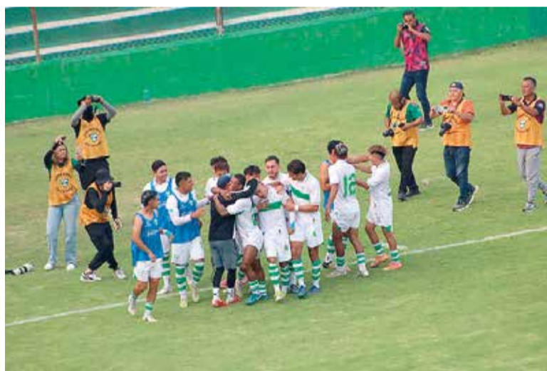
LOS LOCALES NO pudieron mantener la ventaja en el marcador.