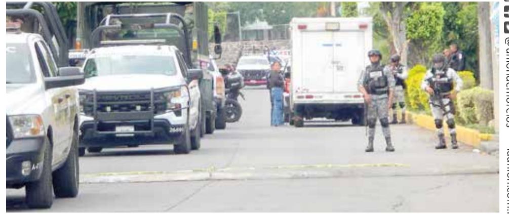
LA VÍCTIMA FUE identificada en el lugar del ataque.