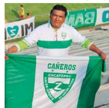
◀ EL "CAMINANTE CAÑERO" estuvo presente en el estadio.