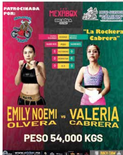
LA MORELENSE ENFRENTARÁ a otra debutante.