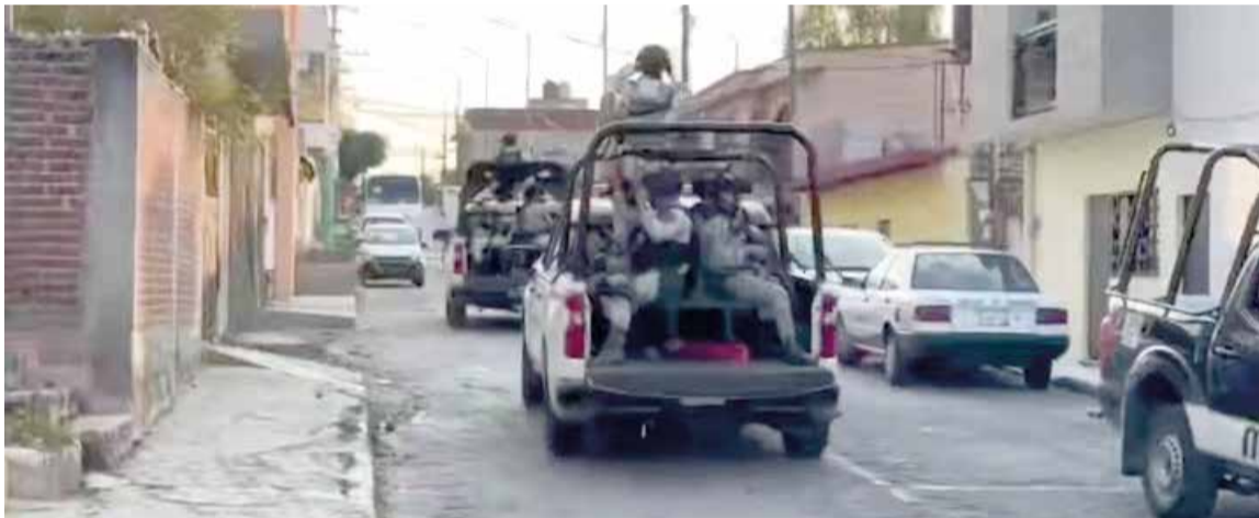
PRESUNTAMENTE LA VÍCTIMA tenía su domicilio en esa misma colonia.

» Fue agredido a balazos en la calle División del Norte de esa colonia de Cuernavaca