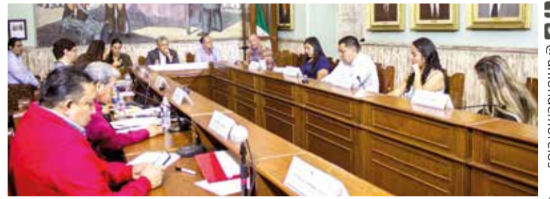
AYER ACUDIERON ANTE el Cabildo los secretarios de Desarrollo Urbano y Obras Públicas y de Desarrollo Sustentable y Servicios Públicos, además del titular del SAPAC.

Asimismo, subrayó que la ciudadanía demanda resultados tangibles en distintos rubros, especialmente en servicios y obras públicas, en un contexto en el que el cumplimiento de obligaciones fiscales ha permitido fortalecer la capacidad financiera