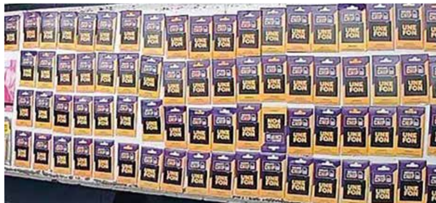
ENTRE LO INCAUTADO hay más de 100 chips de diversas compañías telefónicas.