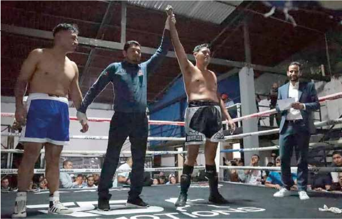
“EL JAGUAR” LLEVA racha perfecta en el profesionalismo.