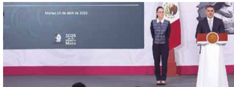
OMAR GARCÍA HARFUCH confirmó la llegada de nuevos elementos de la Guardia Nacional a la entidad en esta semana.

› LA PRESIDENTA CLAUDIA SHEINBAUM DIO A CONOCER LA CONFORMACIÓN DE LA ESCUELA PARA MANDOS EN LA ACADEMIA NACIONAL DE SEGURIDAD PÚBLICA, PARA LA PREPARACIÓN DE SECRETARIOS DE SEGURIDAD; EL TITULAR DE LA SSPC FEDERAL ANUNCIA EL REFORZAMIENTO DE LA SEGURIDAD EN MORELOS P.5