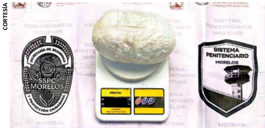
DURANTE EL OPERATIVO presuntamente encontraron más de un kilo de "cristal".

» PRESUNTAMENTE TRATARON de introducir celulares, chips telefónicos, droga, armas blancas, entre otros objetos ilícitos