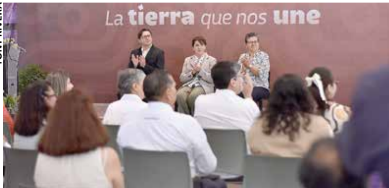
LA INNOVACIÓN ES una herramienta clave para el bienestar social y el progreso de la entidad, expuso la mandataria durante el acto en el Museo Morelense de Arte Contemporáneo (MMAC) Juan Soriano, en Cuernavaca.