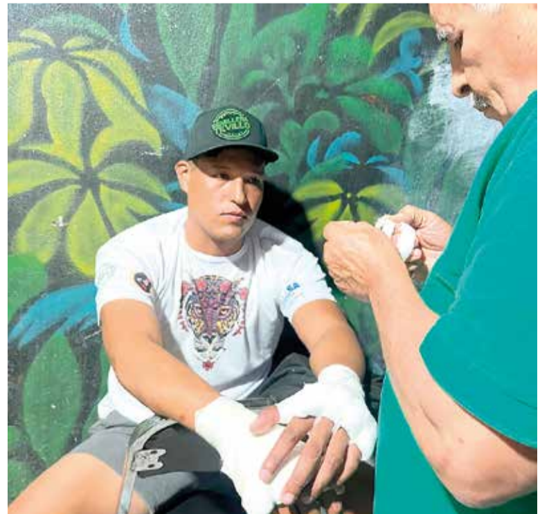
ES UN BOXEADOR que se destaca por su disciplina y exigente preparación.