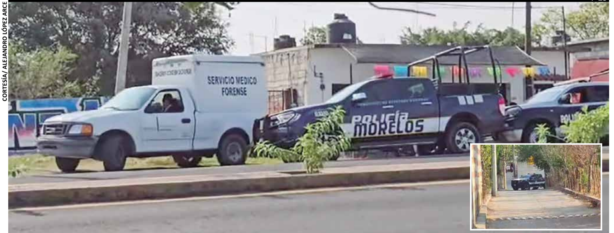
UNO DE LOS ataques se registró en la avenida Miguel Hidalgo de la cabecera y el otro en la calle La Raza (recuadro) de la colonia Benito Juárez, la tarde del martes.