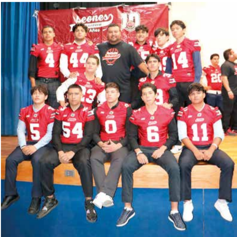
LOS LINEBACKERS DEL equipo.

2026 durará dos meses, empezando hoy y terminando el 31 de mayo. Enfrentarán a rivales como Broncos Prepa 1, Fantasmas de la IMA, Anáhuac Norte, Centinelas Warriors Presidenciales, entre otros. Tanto familiares y amigos, como parte del staff, así como los jugadores, se tomaron fotos con los colores de la nueva indumentaria. “Le pido a la familia de Leones Cuernavaca que nos siga apoyando como hasta ahora, que nos apoye en los juegos de local, para que se haga pesar la localía”, agregó el profe Godoy.