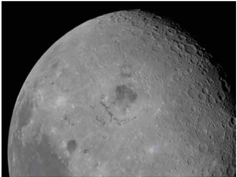
En esta vista de la Luna, tomada por la tripulación de Artemis II a las 18:19 GMT, justo antes de que comenzara su periodo de observación, se aprecia la cuenca Oriental en el centro, con un parche negro de lava antigua que atravesó la corteza lunar durante una erupción ocurrida hace miles de millones de años. Este cráter de impacto, de aproximadamente 965 km de diámetro, se encuentra en la transición entre el lado cercano y el lado lejano de la Luna y, en ocasiones, puede observarse parcialmente desde la Tierra. A la izquierda se ve el pequeño y brillante cráter Byrgius, del cual se extienden rayos de 400 km desde su cuenca, evidenciando la violencia del impacto que lo formó. En el momento de la fotografía, la nave se encontraba aproximadamente a 58,400 km de la Luna y 380,000 km de la Tierra, ofreciendo una perspectiva cercana y detallada de estas antiguas estructuras lunares.