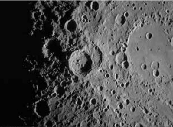
Vista en primer plano capturada por la tripulación de Artemis II del cráter Vavilov, situado en el borde de la cuenca más grande y antigua Hertzsprung. En la parte derecha del encuadre se aprecia la transición entre el material más suave del interior; dentro del anillo de moatlands, y el terreno más accidentado alrededor del borde exterior. El cráter Vavilov y otros cráteres cercanos, junto con el material expulsado durante sus impactos, se destacan gracias a las sombras alargadas del terminator; la línea que separa el día de la noche lunar. La imagen fue tomada con una cámara de mano a una distancia focal de 400 mm, mientras la tripulación sobrevolaba el lado lejano de la Luna en el sexto día de la misión, alrededor de las 19:00 GMT. En ese momento, la nave se encontraba a aproximadamente 58,500 km de la Luna y 380,000 km de la Tierra, ofreciendo una perspectiva cercana y detallada de la topografía lunar.