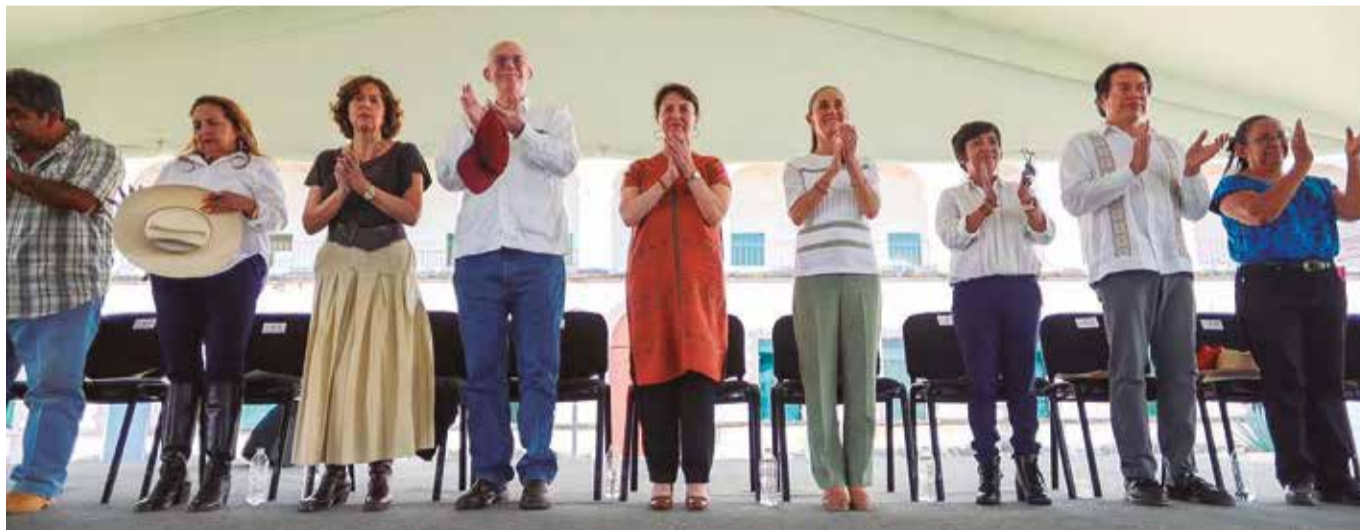
DURANTE EL EVENTO se destacó que la memoria de Emiliano Zapata debe asumirse como una presencia viva.

» Encabezan Claudia Sheinbaum y Margarita González Saravia homenaje al Caudillo del Sur en su CVII aniversario luctuoso P.4