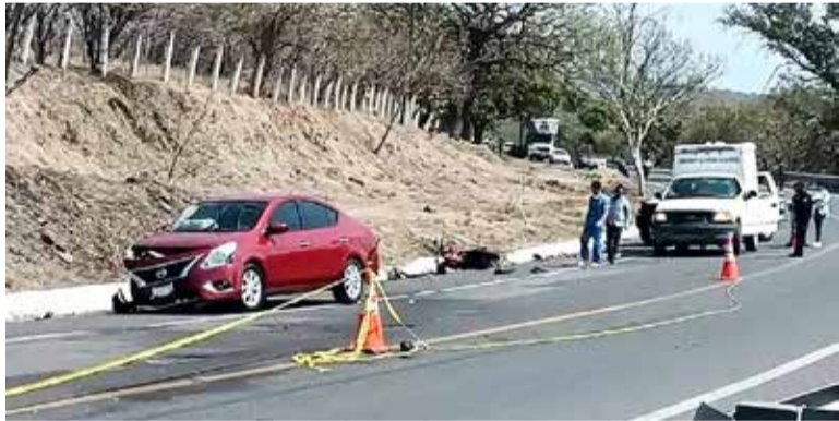
SE DESCONOCE EL grado de responsabilidad de los involucrados en el choque.