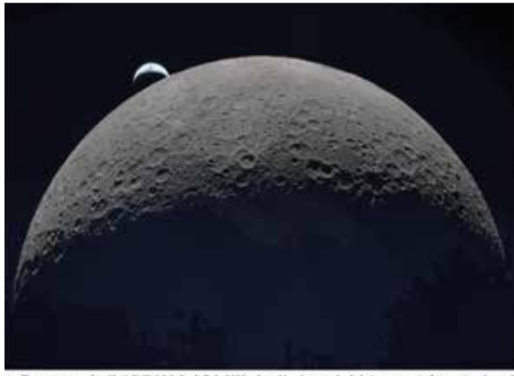
La Tierra se pone a las 22:41 GMT del 6 de abril de 2026 sobre el borde curvado de la Luna; en esta foto capturada por la tripulación de Artemis II durante su viaje alrededor del lado lejano del satélite. La cuenca Oriental se aprecia en el borde de la superficie lunar visible. La cuenca Hertzsprung aparece como dos sutiles anillos concéntricos, interrumpidos por Vavilov, un cráter más joven superpuesto a la estructura más antigua. Las líneas de indentaciones que se observan son cadenas de cráteres secundarios, formadas por material expulsado durante el enorme impacto que creó la cuenca Oriental. La parte oscura de la Tierra está en plena noche, mientras que en el lado diurno se distinguen nubes arremolinadas sobre Australia y Oceanía. En el momento de la fotografía, la nave se encontraba aproximadamente a 58,400 km de la Luna y 380,000 km de la Tierra, ofreciendo una vista cercana de los detalles geológicos de la superficie lunar y del planeta desde el espacio profundo.