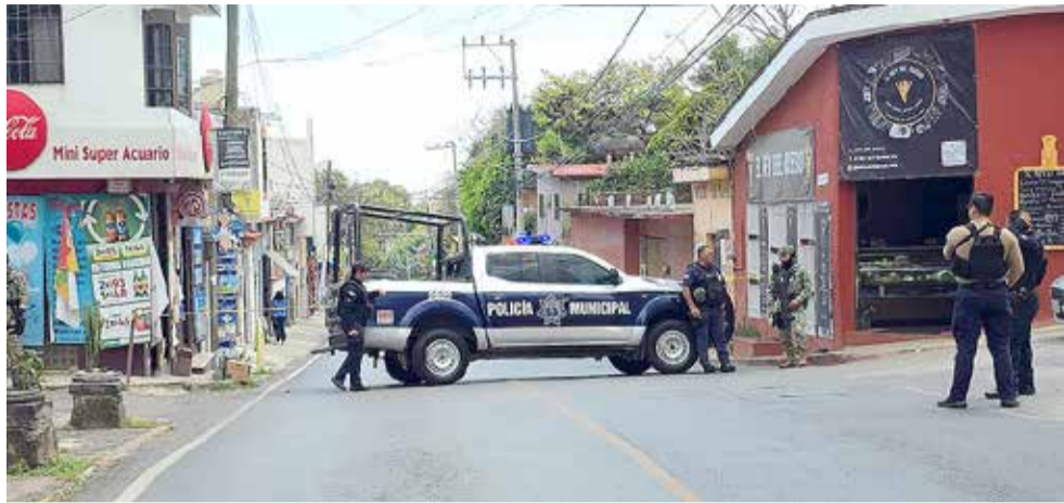
EN LA ZONA quedaron varios casquillos esparcidos.