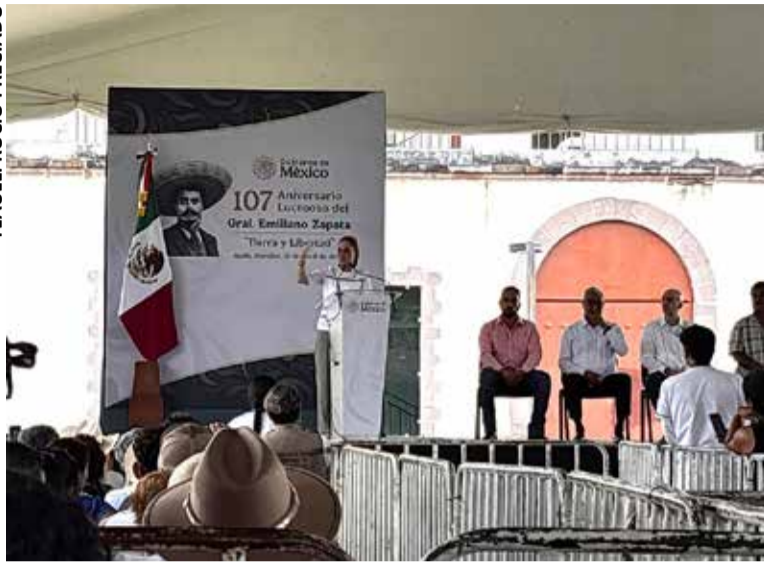
LA PRESIDENTA RECORDÓ los ideales del líder revolucionario.

para Morelos. Asimismo, resaltó la entrega de certificados en todo el país, en especial a ejidatarias y depositarias comuneras. Luego de exponer la relevancia del pensamiento zapatista y su influencia en la filosofía de la Cuarta Transformación y en su gobierno, la presidenta ratificó su convicción por impulsar a las mujeres en el campo. Durante el acto, la presidenta dedicó buena parte de su discurso a resaltar la reforma electoral alcanzada, que contempla —a partir de