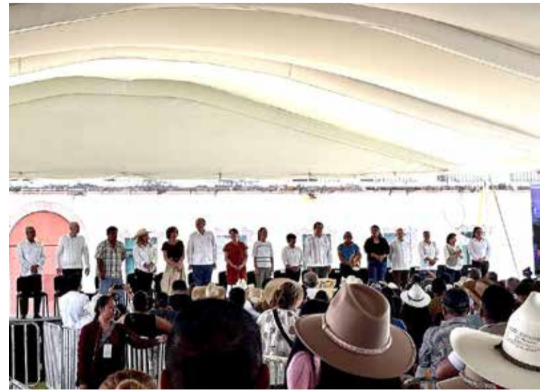
FUNCIONARIOS DE DIVERSAS dependencias acompañaron a las mandatarias en el acto conmemorativo.

2030— múltiples reducciones de recursos, que podrán ser dirigidos a beneficios directos para el pueblo. En este sentido, recalcó que ya no habrá nepotismo ni reelección en ningún nivel de gobierno. De igual forma, hizo un reconocimiento a la gobernadora de Morelos por su larga trayectoria política en la izquierda y su labor en el gobierno estatal, siendo la primera titular del Ejecutivo en la entidad. Por otra parte, la mandataria federal celebró que la esencia del Plan B fue aprobada y ya es constitucional. Lo anterior, luego de ser avalada