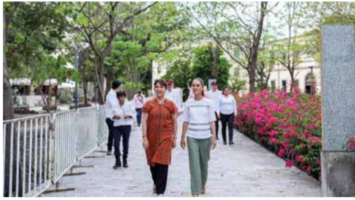
LAS MANDATARIAS Y otros funcionarios montaron una guardia de honor en memoria del General Zapata.

» CON ACCIONES DE JUSTICIA PARA EL CAMPO Y SUS MUJERES