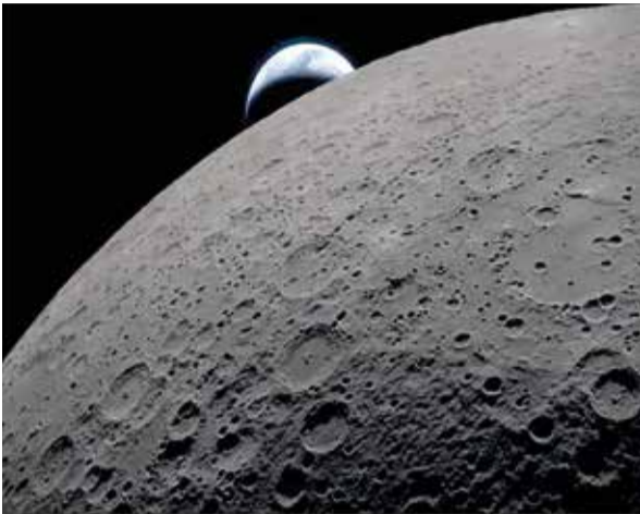
La superficie lunar llena el encuadre con detalles nítidos durante el sobrevuelo lunar de Artemis II, mientras se observa una Tierra distante posándose en el fondo. La imagen fue tomada a las 22:41 GMT, apenas tres minutos antes de que la nave Orión y su tripulación pasaran detrás de la Luna, perdiendo contacto con la Tierra durante unos 40 minutos antes de emerger por el otro lado. En la imagen, la parte oscura de la Tierra está en plena noche, mientras que en el lado diurno se distinguen nubes arremolinadas sobre Australia y Oceanía. En primer plano, el cráter Ohm presenta bordes en forma de terraza y un fondo relativamente plano marcado por picos centrales, formados cuando la superficie lunar se elevó tras el impacto que originó el cráter. En el momento de la fotografía, la nave se encontraba aproximadamente a 58,400 km de la Luna y 380,000 km de la Tierra, ofreciendo una vista cercana y única tanto del terreno lunar como del planeta.