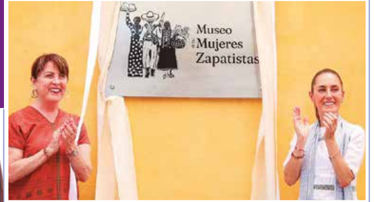
LAS MANDATARIAS DEVELARON la placa inaugural y recorrieron las instalaciones del nuevo recinto.