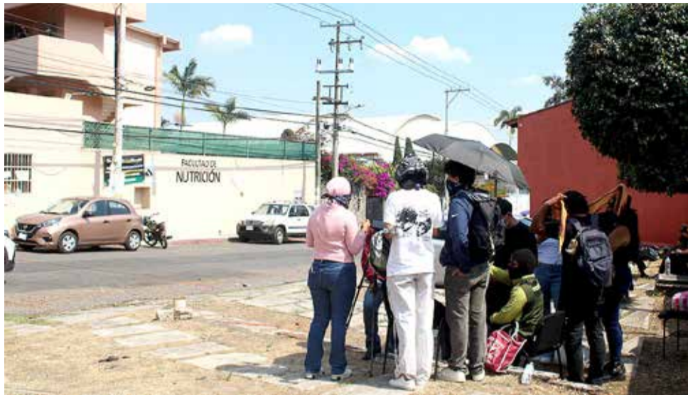
EL PASADO MIÉRCOLES, integrantes de la Resistencia Estudiantil denunciaron haber sido hostigados por la directora de la Facultad de Nutrición.