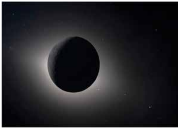
Capturado por la tripulación de Artemis II durante su sobrevuelo lunar el 6 de abril de 2026, esta imagen muestra la Luna eclipsando completamente al Sol. Desde la perspectiva de la tripulación, la Luna se ve lo suficientemente grande como para bloquear totalmente al Sol, creando casi 54 minutos de totalidad y ofreciendo una vista mucho más amplia de lo que sería posible desde la Tierra. La corona solar forma un halo brillante alrededor del disco lunar oscuro, revelando detalles de la atmósfera externa del Sol que normalmente están ocultos por su intensidad luminosa. También son visibles estrellas, que normalmente son demasiado tenues para fotografiar junto a la Luna, pero que con la Luna en sombra se pueden capturar claramente. Este punto de vista único ofrece tanto una imagen impactante como una oportunidad valiosa para que los astronautas documenten y describan la corona durante el regreso de la humanidad al espacio profundo. En la imagen también se aprecia un tenue resplandor del lado cercano de la Luna, iluminado por la luz reflejada desde la Tierra.