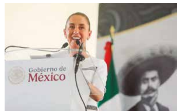
ESTE VIERNES, LA presidenta visitó Ayala para encabezar diversos actos; ratificó su convicción por impulsar a las mujeres en el campo.

» DURANTE SU VISITA A MORELOS, LA PRESIDENTA CLAUDIA SHEINBAUM INFORMÓ QUE LA ENTIDAD SERÁ BENEFICIADA CON PRESAS Y OTRAS ACCIONES A FAVOR DEL CAMPO; CELEBRA APROBACIÓN DEL PLAN B DE LA REFORMA ELECTORAL P.3