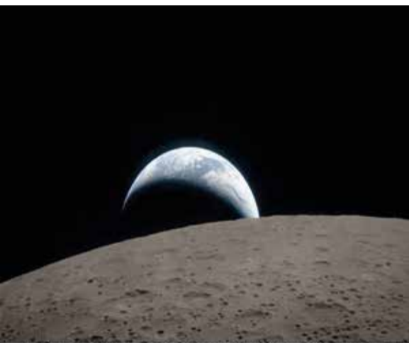
Punto de la Tierra capturado desde la ventana de la nave Orión a las 22:41 GMT del 6 de abril de 2026, durante el sobrevuelo lunar de la tripulación de Artemis II. La Tierra, de un azul suave con nubes blancas brillantes, se oculta detrás de la superficie lunar llena de cráteres. La parte oscura del planeta está en plena noche, mientras que en el lado diurno se observan nubes arremolinadas sobre Australia y Oceanía. En primer plano, el cráter Ohm presenta bordes en forma de terraza y un fondo plano interrumpido por picos centrales. Estos picos se forman en cráteres complejos cuando la superficie lunar, líquida por el impacto, se eleva hacia arriba durante la creación del cráter. En el momento de la fotografía, la nave se encontraba aproximadamente a 58,400 km de la Luna y a 380,000 km de la Tierra, ofreciendo una vista única de ambos cuerpos celestes desde cerca del satélite.