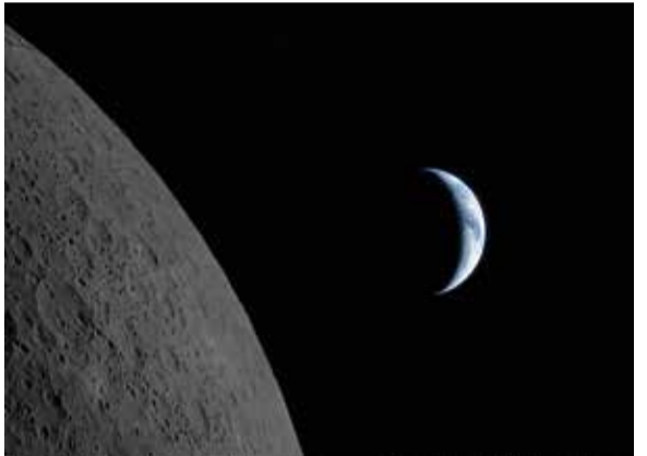
Nuestro planeta se acerca a pasar detrás de la Luna en esta imagen capturada por la tripulación de Artemis II durante su sobrevuelo lunar, aproximadamente seis minutos antes de la puesta de la Tierra. La Tierra se muestra en fase de creciente, con la luz solar proveniente de la derecha. La parte oscura del planeta está en plena noche, mientras que en el lado diurno se observan nubes arremolinadas sobre un azul suave, en la región de Australia y Oceanía. Sobre la accidentada superficie lunar se ven líneas de pequeñas depresiones, correspondientes a cadenas de cráteres secundarios, formadas por material expulsado durante un impacto primario violento. En el momento de la fotografía, la nave se encontraba aproximadamente a 58,400 km de la Luna y 380,000 km de la Tierra, ofreciendo una vista cercana y espectacular del límite entre nuestro planeta y su satélite.