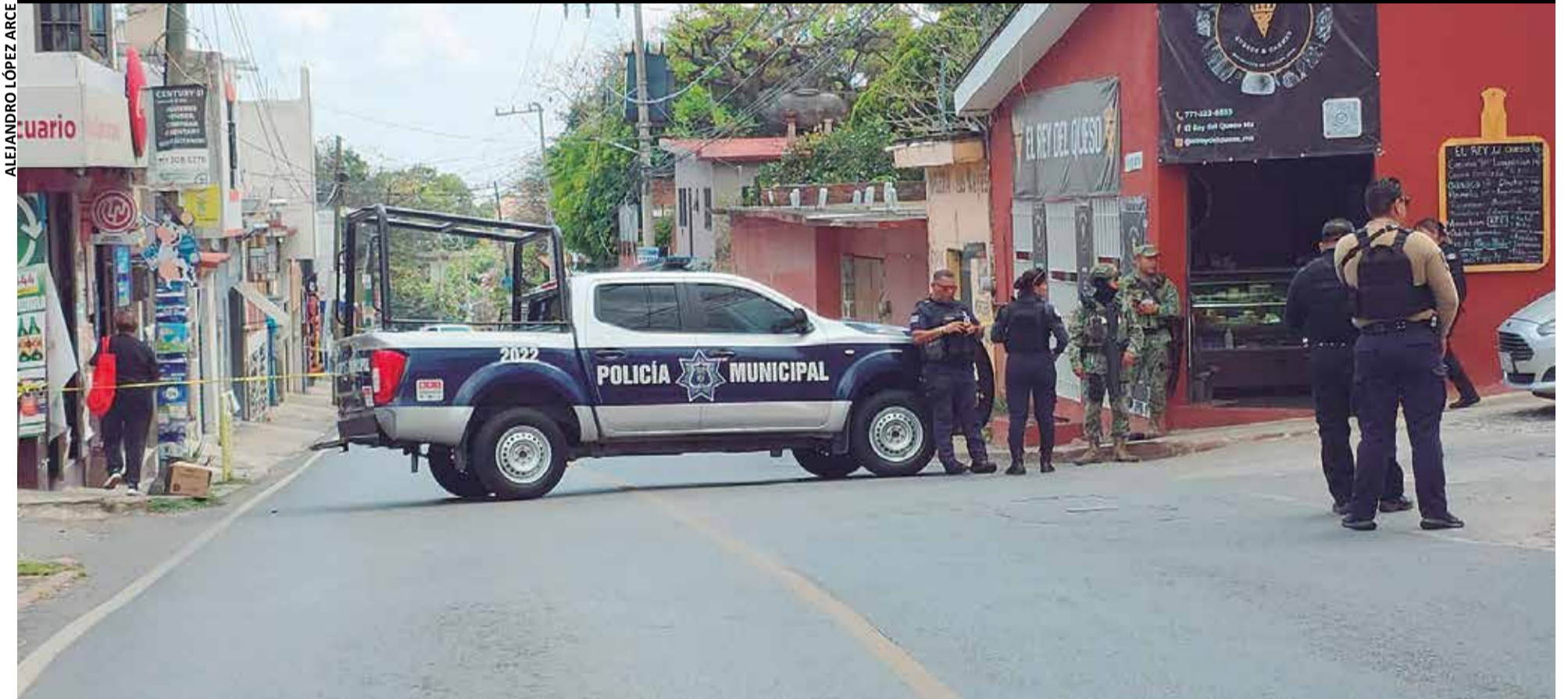
EL INDIVIDUO FUE atacado en un establecimiento que se ubica en la Calzada de los Reyes, la tarde del viernes.

DE VARIOS disparos, un individuo fue asesinado en la comunidad de Tetela del Monte de Cuernavaca; en el sitio hallaron al menos 18 casquillos percutidos P:14