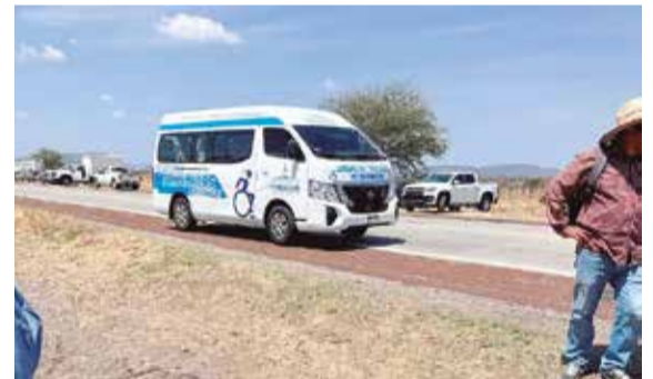
AGRICULTORES ABRIERON LA circulación en la autopista Siglo XXI, a la altura de Temoac.

› PRODUCTORES DE GRANOS BÁSICOS DE LA REGIÓN ORIENTE AGUARDAN LA FIRMA DE COMPROMISOS CON AUTORIDADES SOBRE RECURSOS Y APOYOS PARA EL CAMPO P.9