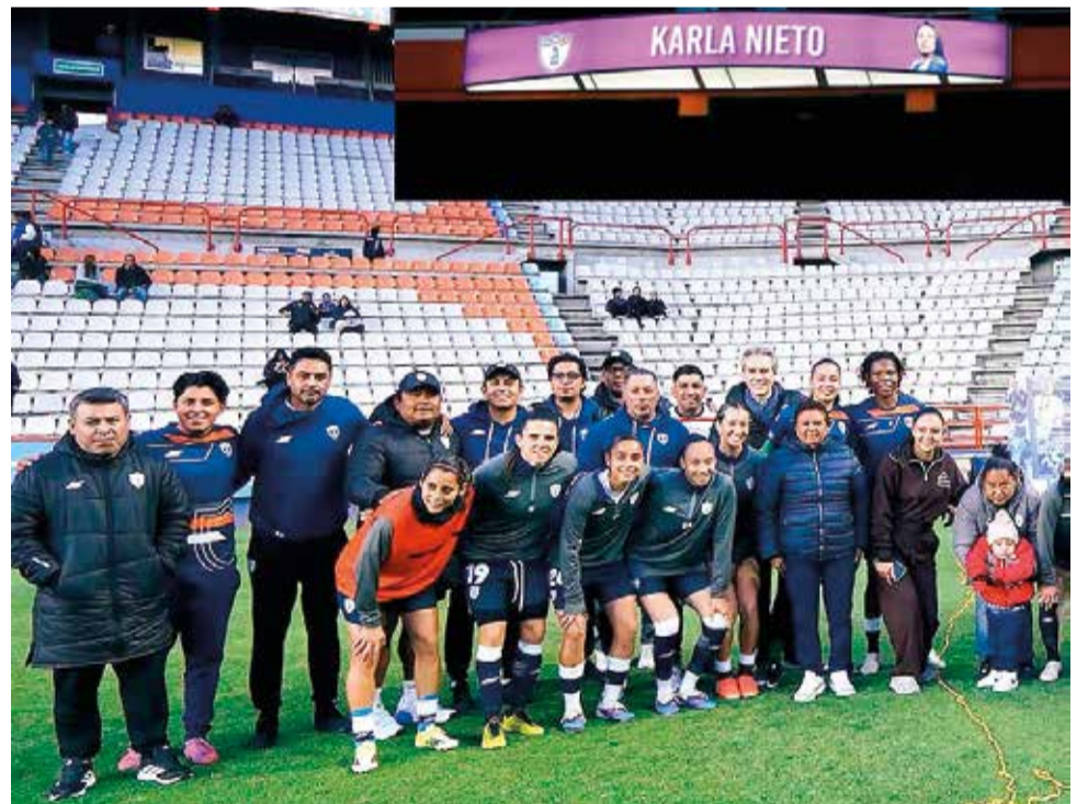
COMPAÑEROS, AMIGOS Y familia acompañaron en este acto a la futbolista originaria de la colonia Otilio Montaña de Jiutepec.