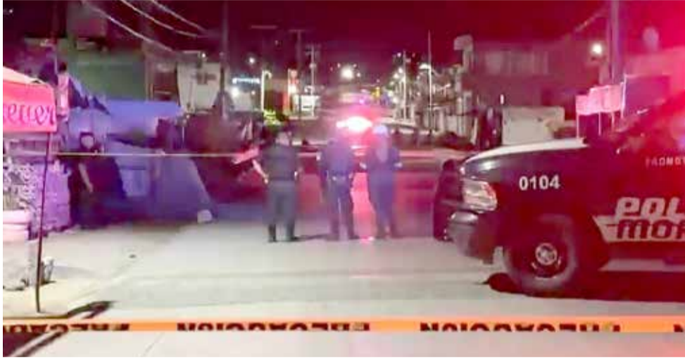
SE DESCONOCEN LAS circunstancias que derivaron en el ataque.