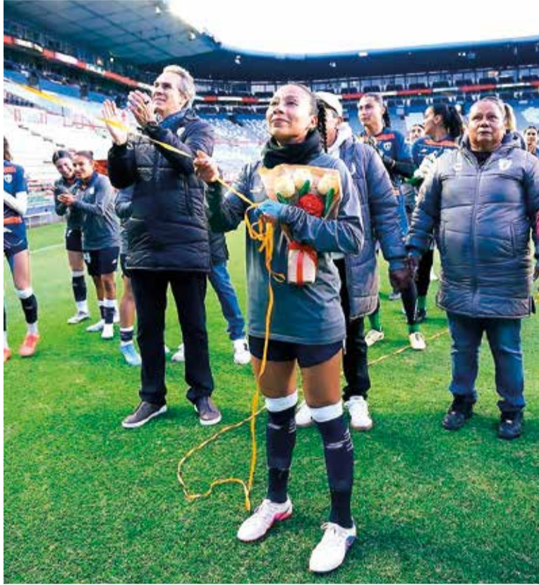
EL MOMENTO DE la develación del nombre en el palco del estadio Hidalgo.

» LA FUTBOLISTA morelense desarrolló junto a su familia, compañeras y directivos del equipo, un palco en el estadio Hidalgo que ahora llevará su nombre