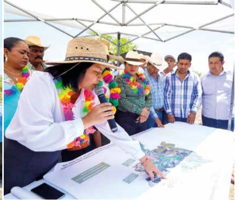
LA MANDATARIA ESTATAL destacó que los trabajos forman parte del programa permanente de rehabilitación de caminos de saca-cosecha que ejecuta la Sedagro en distintos municipios del estado.