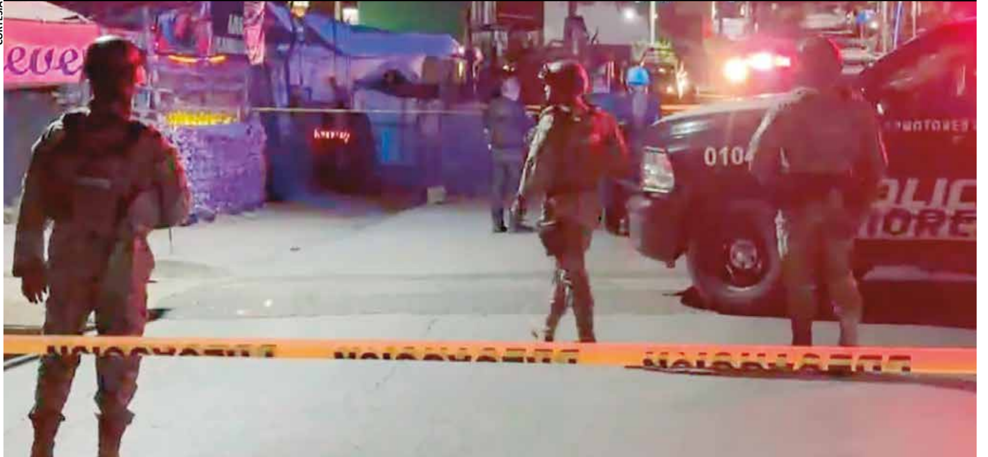
LA VÍCTIMA FUE agredida en un bar que se localiza a orillas de la carretera Yautepec-Tlayacapan, la noche del lunes.

» UNA MUJER trans fue privada de la vida a balazos en un establecimiento que se ubica en la colonia Las Vivianas del municipio de Tlayacapan P.14