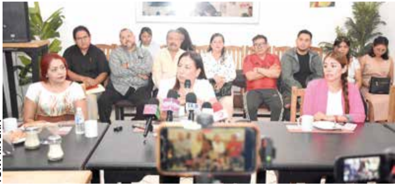
LA EXDIRECTORA DEL IMRyT dijo que esperará los tiempos oficiales para inscribirse por una candidatura.