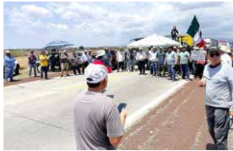
EL DIÁLOGO FORMAL inició la tarde del lunes en el punto de la protesta.

En los primeros minutos de este martes 7 de abril, fue liberada la circulación en la autopista Siglo XXI, a la altura del municipio de Temoac, luego de que productores de granos básicos de la región oriente de Morelos mantuvieran un bloqueo en protesta. La movilización, que formó parte del Paro Nacional Agrícola y Transportista, concluyó tras intensas horas de negociación con las autoridades, permitiendo restablecer el tránsito en este importante tramo carretero. El diálogo formal inició la tarde del lunes con la llegada de representantes de los gobiernos estatal y federal al punto del conflicto. Durante el encuentro, los campesinos expusieron la crítica situación financiera que atraviesa el sector, derivada del incumplimiento del pago de las cosechas correspondientes al ciclo 2025 por parte de Alimentación para el Bienestar. Esta falta de liquidación ha generado una descapitalización severa en el gremio, impidiéndoles cubrir las deudas adquiridas y planificar la operatividad del presente año. Una de las demandas más urgentes presentadas ante los funcionarios es la liberación de recursos para costear la siembra del próximo ciclo agrícola, el cual está previsto para iniciar en solo dos meses. Los productores enfatizaron que sin el pago inmediato de la producción ya entregada y sin el acceso a nuevos créditos y financiamientos, se pone en riesgo la soberanía alimentaria y el sustento de miles de familias que dependen exclusivamente de la tierra.