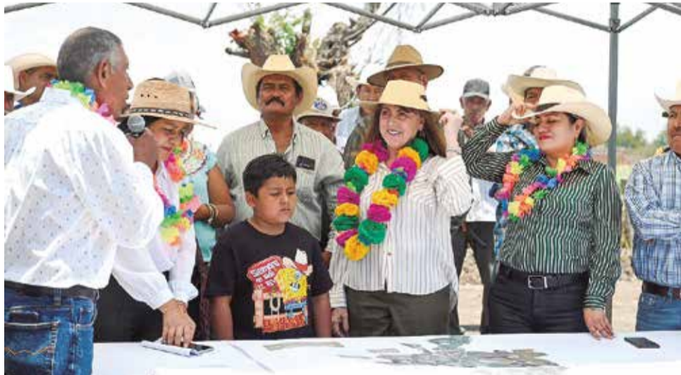
EN AYALA, LA mandataria reiteró el compromiso de su administración con el fortalecimiento del campo.

› La gobernadora supervisó la rehabilitación de caminos de saca-cosecha en el ejido de San Pedro Apatlaco, en Ayala › La intervención facilita el traslado de productos agrícolas y fortalece la actividad del campo, destaca el gobierno estatal P.3