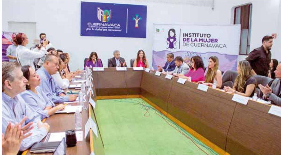
EL ALCALDE JOSÉ Luis Urióstegui presidió la primera sesión ordinaria del Sistema Municipal para Prevenir, Atender, Sancionar y Erradicar la Violencia contra las Mujeres.

» EL AYUNTAMIENTO capitalino mantiene semáforo verde en el PASEMUN con acciones que fortalecen la seguridad y el bienestar integral de mujeres, niñas y adolescentes, se informó en sesión ordinaria del Sistema Municipal