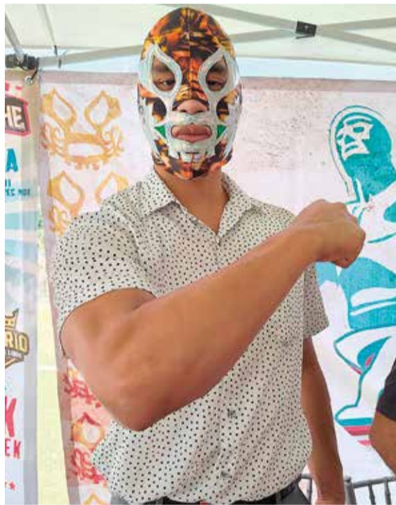
HIJO DE CANEK.