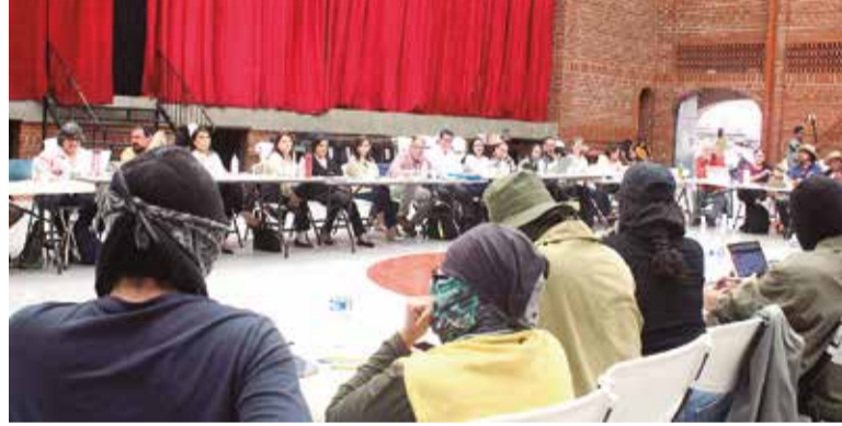
EN EL SEMINARIO San José, la UAEM presentó el plan integral de acción académica, para garantizar la continuidad del semestre en la institución.

› AVANZAN ACUERDOS EN MATERIA DE SEGURIDAD ENTRE AUTORIDADES UNIVERSITARIAS Y ESTUDIANTES; ESTABLECEN EL 19 JUNIO PARA LA CONCLUSIÓN DE LAS CLASES DEL SEMESTRE ENERO-JUNIO 2026 P.9