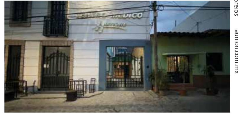
LA CLÍNICA CONTRA la que dispararon resultó con diversos daños.