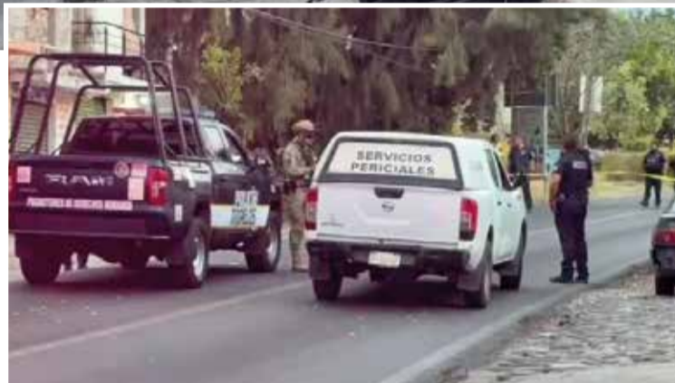
EN LA ESCENA del crimen quedó un hombre sin vida; la otra víctima murió al llegar a un hospital.