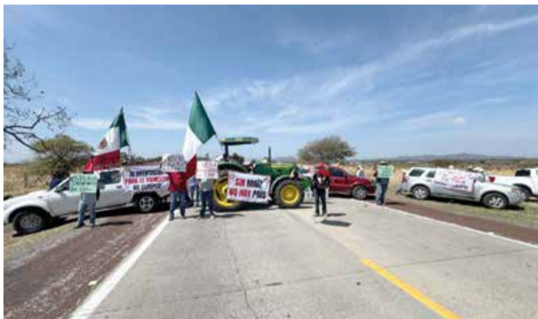
CAMPESINOS CERRARON LA autopista Siglo XXI, a la altura del poblado de Amilcingo.

» Demandan garantías para el próximo ciclo agrícola