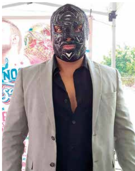
MÁSCARA AÑO 2000 Jr.