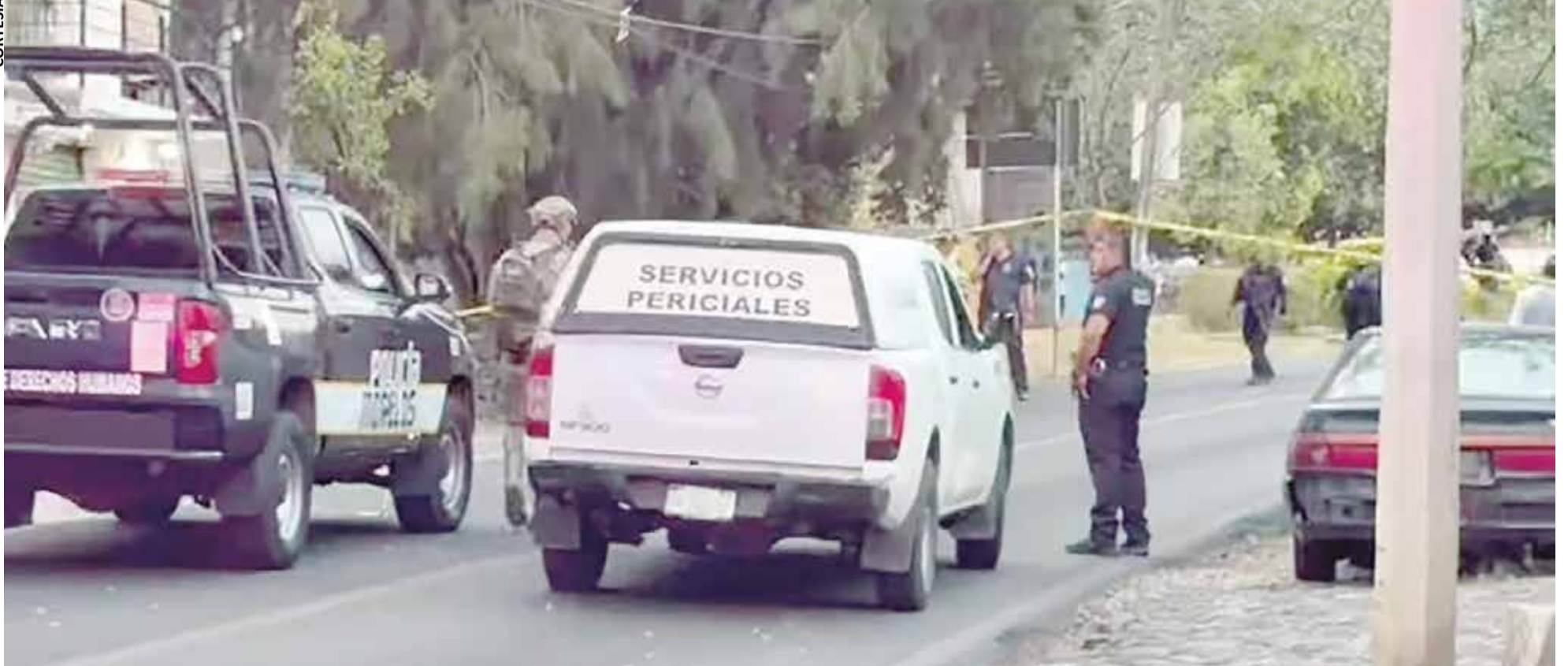
EL ATAQUE CONTRA varias personas ocurrió sobre la carretera Xochimilco-Oaxtepec, la tarde del lunes.