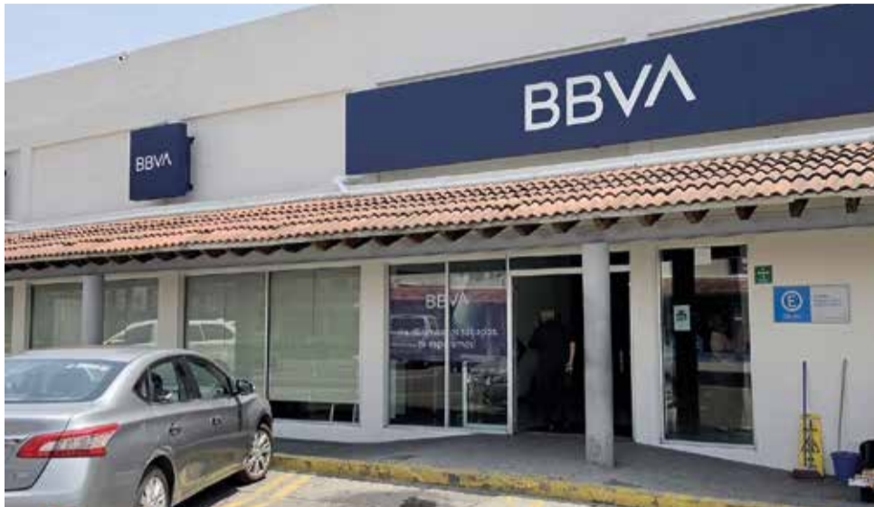
EL HOMBRE ACABABA de retirar el dinero cuando fue abordado por los delincuentes.

» UN HOMBRE fue asaltado por dos individuos instantes después de haber retirado el dinero, en la colonia Empleado Postal de Cuautla