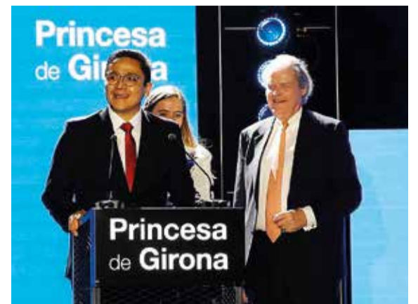
2018 una de las prestigiosas plazas de “astrofísico residente” del Instituto de Astrofísica de Canarias, donde desarrolló su tesis doctoral con mención cum laude.