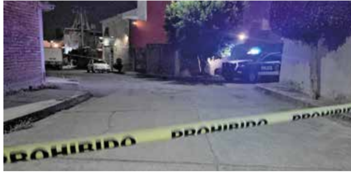
CUANDO LLEGARON LOS policías, la víctima ya había muerto.