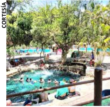
ESTA SEMANA SE incrementó el número de visitantes en los balnearios de la zona sur.

Destacó que las altas temperaturas que se han registrado en la entidad han favorecido la llegada de turistas, posicionando a los balnearios como una de las principales opciones para vacacionar, tanto para familias como para grupos de amigos que buscan