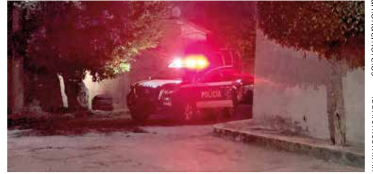
EL JOVEN NO fue identificado en la escena del crimen.