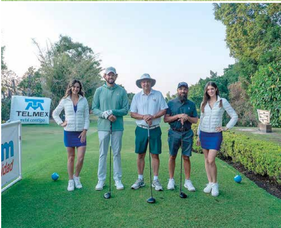
HOY SE LLEVARÁ a cabo la ronda final de estas categorías y la premiación de los ganadores.