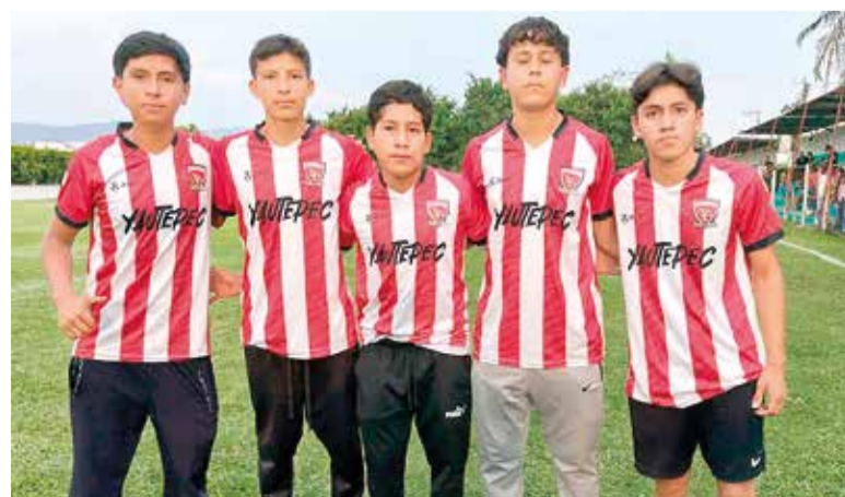
LA CANTERA DEL Atlético Cuernavaca.