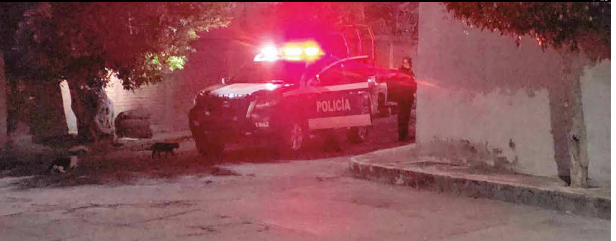
LA VÍCTIMA FUE encontrada sin vida en una esquina de las calles Bugambilias y Aguascalientes, la mañana del viernes.