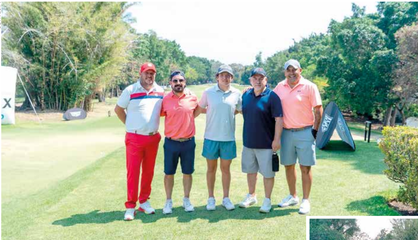
ALGUNOS DE LOS participantes de las categorías Campeonato, AA, A y B.