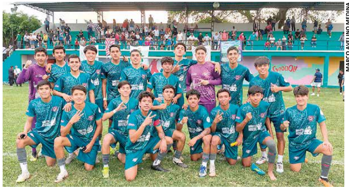
EL REAL MORELOS 27 sacó el punto extra al imponerse en penales.