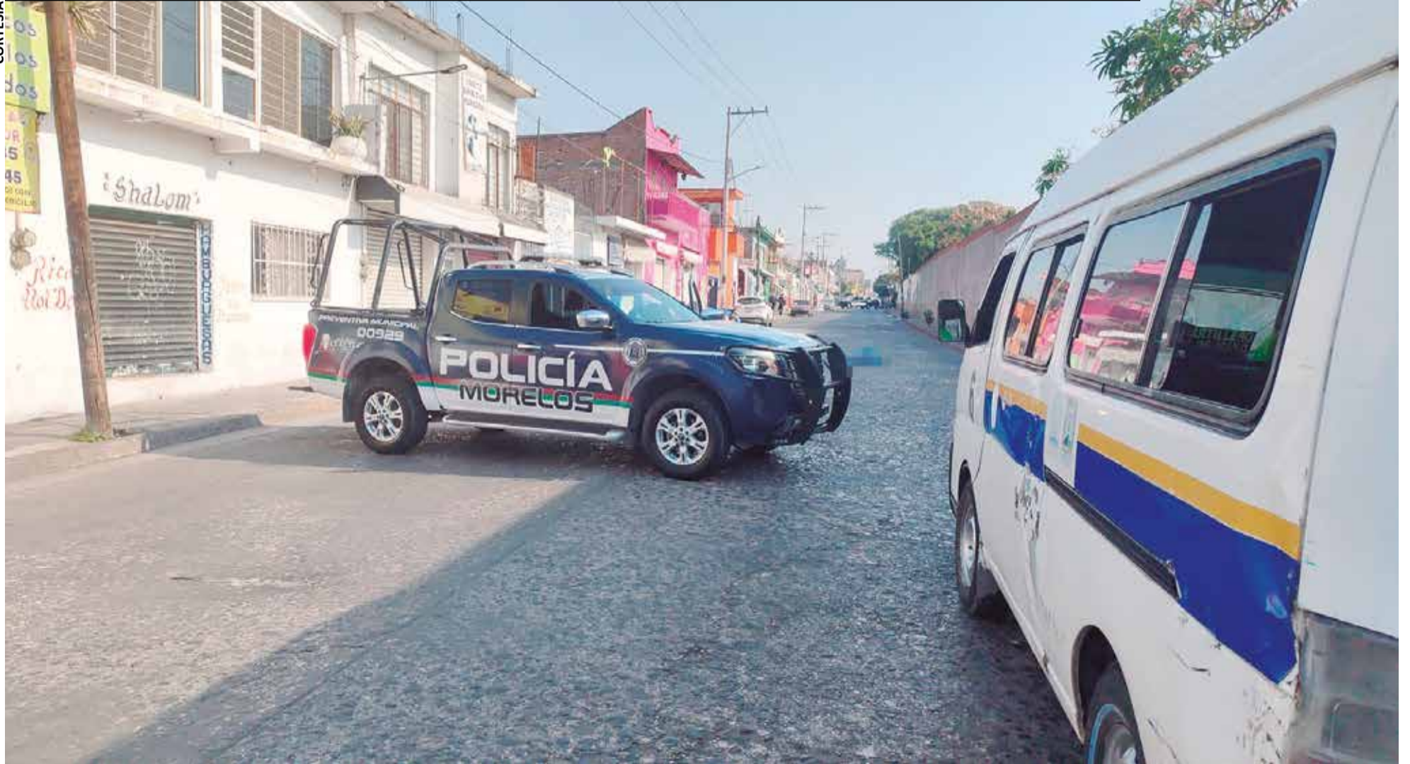
LA VÍCTIMA QUEDÓ sin vida a unos metros de la combi que conducía.

› UN OPERADOR de la Ruta 6 fue asesinado a balazos en la colonia Centro de la cabecera municipal de Cuautla P.14