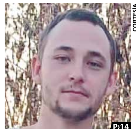
UN JOVEN DESAPARECIÓ EN TEQUESQUITENGO